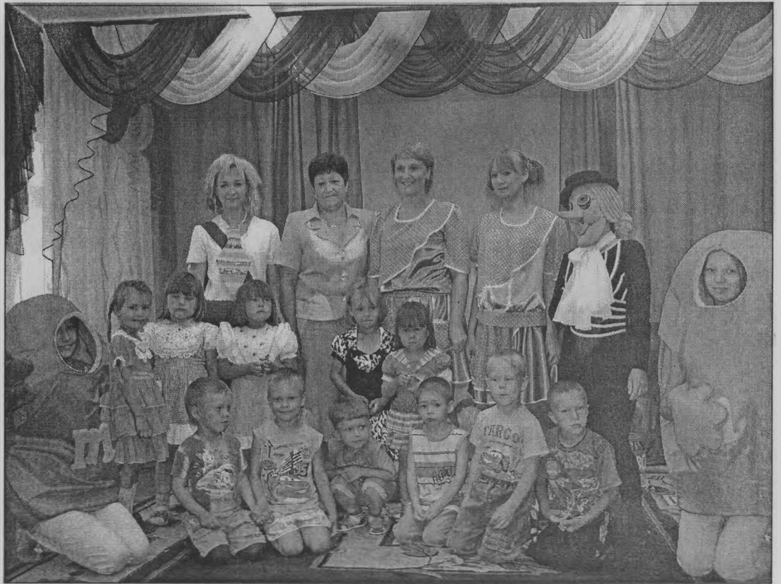
◆ На память о радостном дне.

Сегодня в здании детсада «Аленушка» все выглядит просто замечательно. Привлекательно выглядит и территория вокруг здания: яркий детский городок, ухоженные цветочные клумбы. И состоялось открытие детского сада после ремонта. В красивом актовом зале собрались дети, родители, воспитатели, представители роо. Работники районного Дома культуры показали театрализованное представление, поиграли с детьми, угостили конфетами.