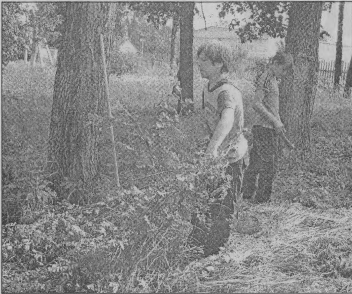
◆ Быть парку ухоженным!

А еще в бригаде проводился Олимпийский день, посвященный 100-летию создания Российского Олимпийского комитета. Провести его нам помогли