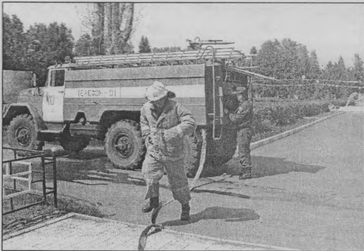
◆ Пожарные прибыли вовремя.

кабинеты опустели — это самолично проверил В. В. Меньков.