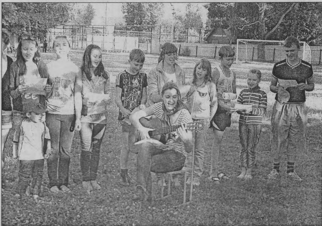
◆ Легко на сердце от песни веселой!

Третье лето у нас в районе работает проект «Дворовая практика». В прошлый и позапрошлый годы было организовано по три площадки. Нынче же их стало в два раза больше.