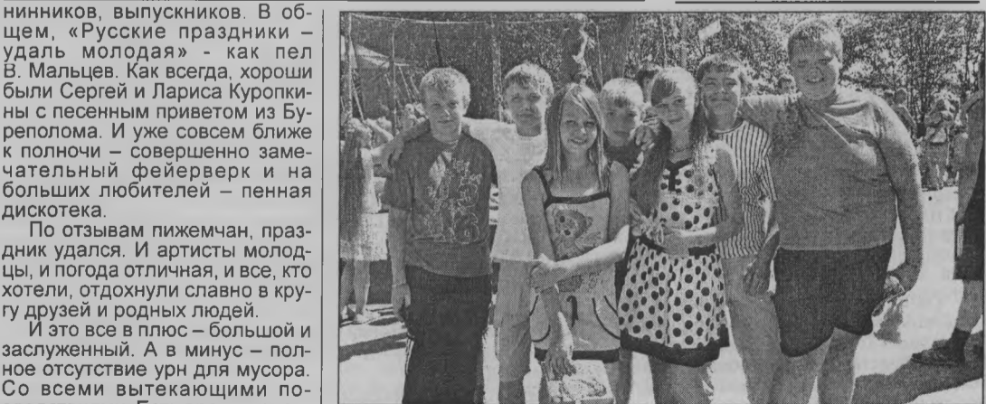
◆ Будущее поселка.