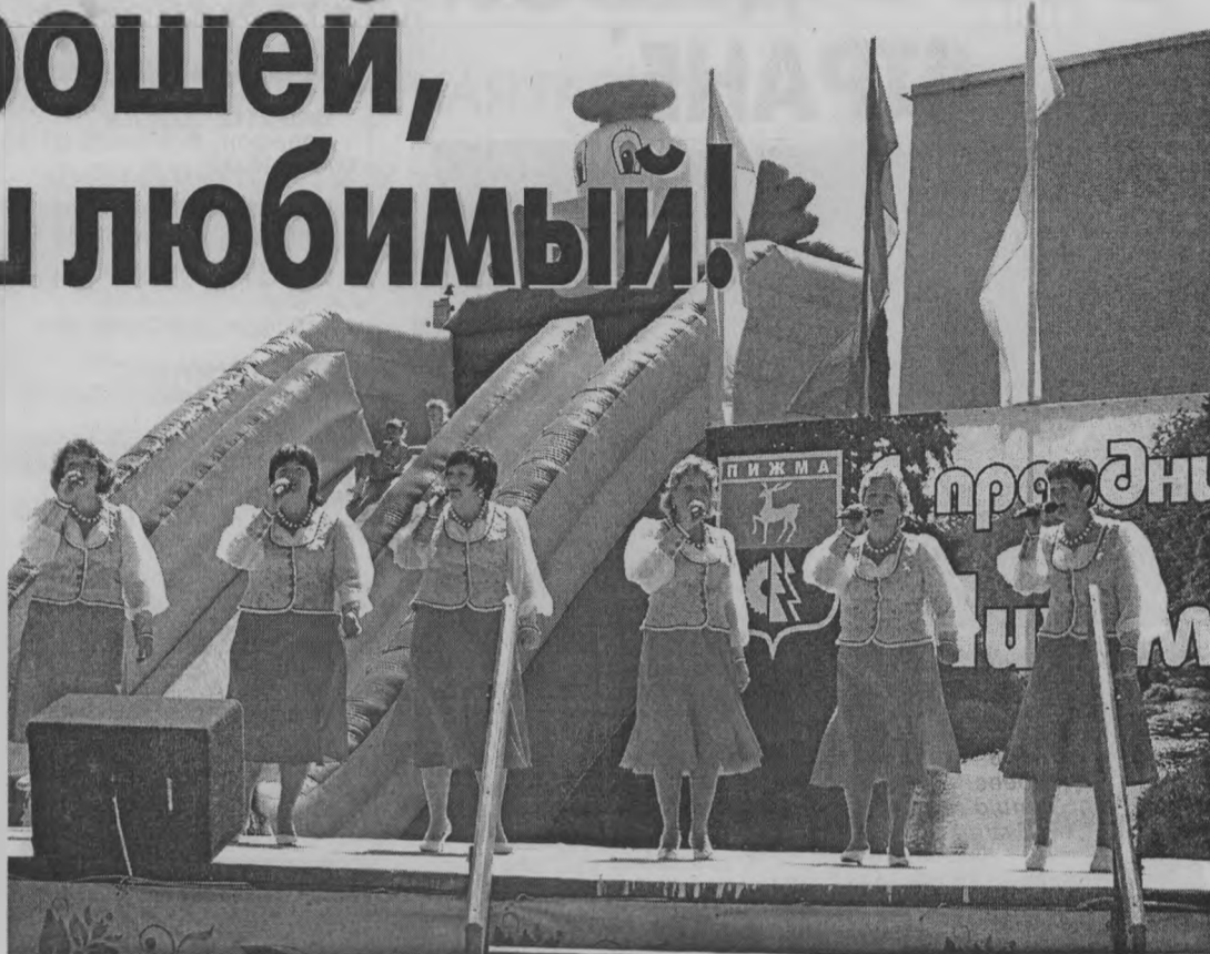
◆ «Девчонки, хочется самого красивого любить!»