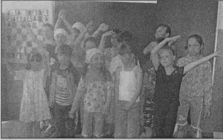
◆ «Мы - вместе!»

За широкими морями, За дремучими лесами, Не на небе – на земле, В Берендеевой стране Жили дети две недели, В мире, дружбе дни летели.