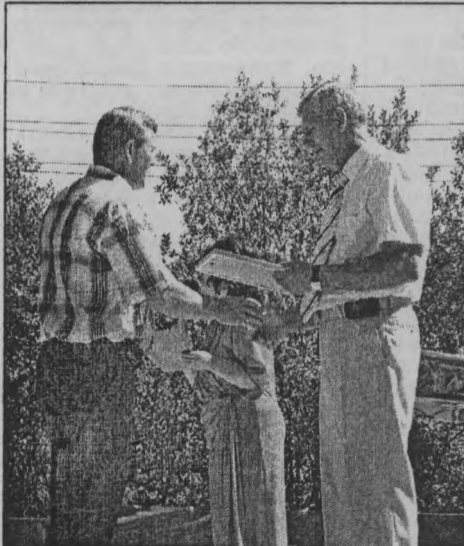
◆ Благодарность за труд.

здоровы. Дай Бог процветания вашему дому и пижемской земле».