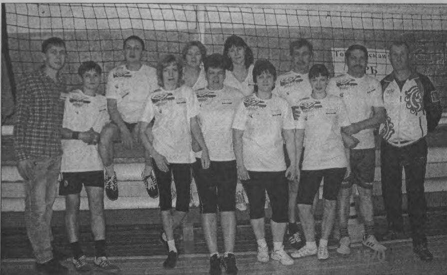
◆ Команда спортивных медработников.