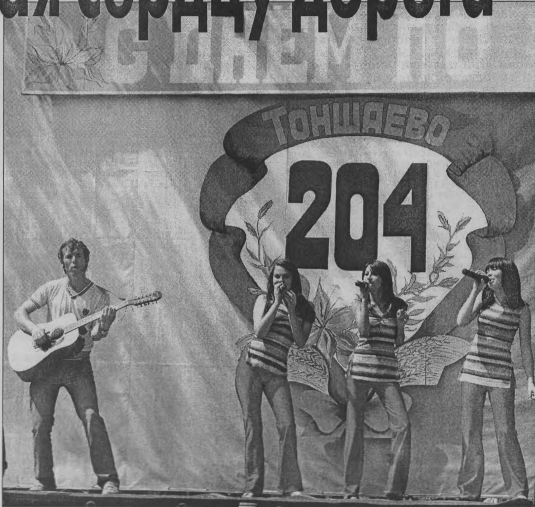
◆ «Мы к вам заехали на час».

ту – 9 исполненных толчков. Для юниора в этом спорте совсем даже неплохо получилось.