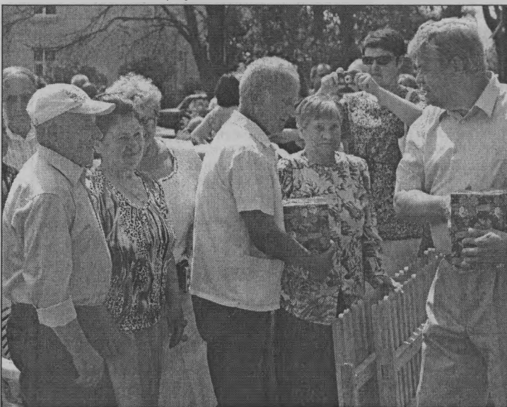
◆ Снова женихи и невесты!

Поселок становится краше благодаря цветоводам-любителям. У нас их, к счастью, мно-