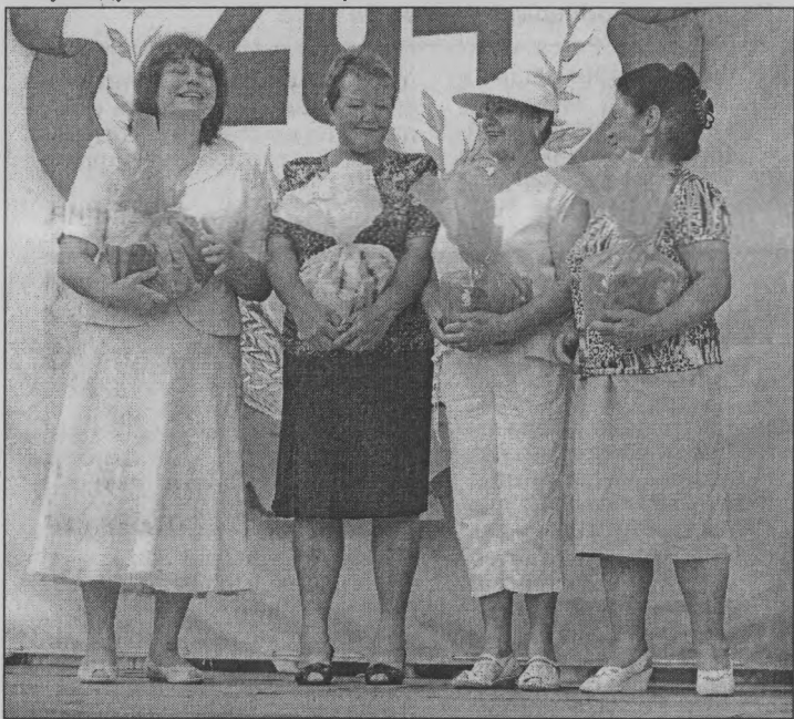
◆ В их саду цветут цветочки.