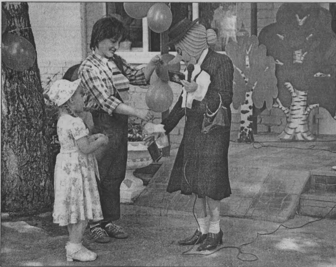
◆ «Так вот ты какая, старуха Шапокляк!»