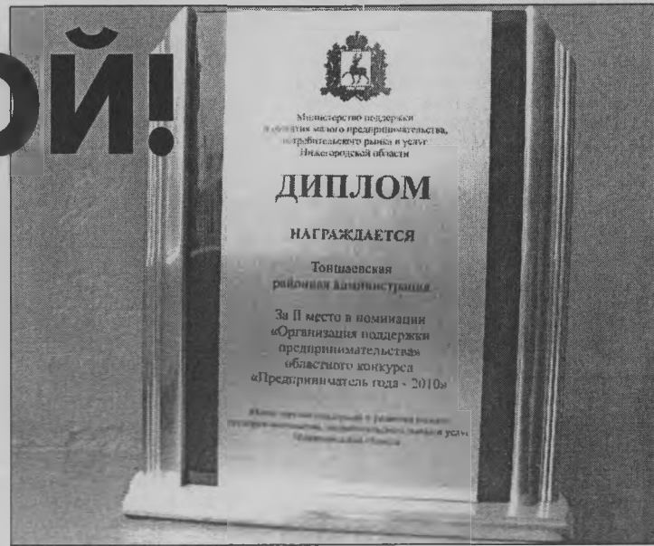
◆ Награда за поддержку малого бизнеса.

По словам наших участников конкурса, награждение они воспринимают как конечный результат напряженного труда