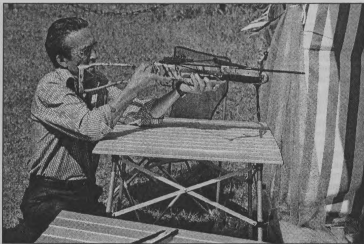
◆ Попаду - не попаду?

Праздник продолжался за полночь... А наутро мы проснулись... уже в другом поселке. И здесь уже не ложка, а целый ковш дегтя. Искоренные урны в парке, разбитые бутылки, мыльная пена в фонтане... И это тоже дело рук тоншаевцев. Конечно, таковых абсолютное меньшинство, но напакостить они смогли всем. Понятно, что они не готовили поселок к празднику: не сажали цветы, не убирали мусор, не красили и не ремонтировали, а вот порушить красоту – это пожалуйста! Выпороть бы этих не-