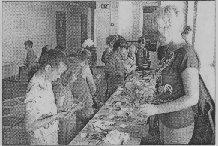
◆ Так... подсчитаем жетончики. Хватит ли на поделку?

- У нас отдыхает сто детей, - говорит начальник первой сме-