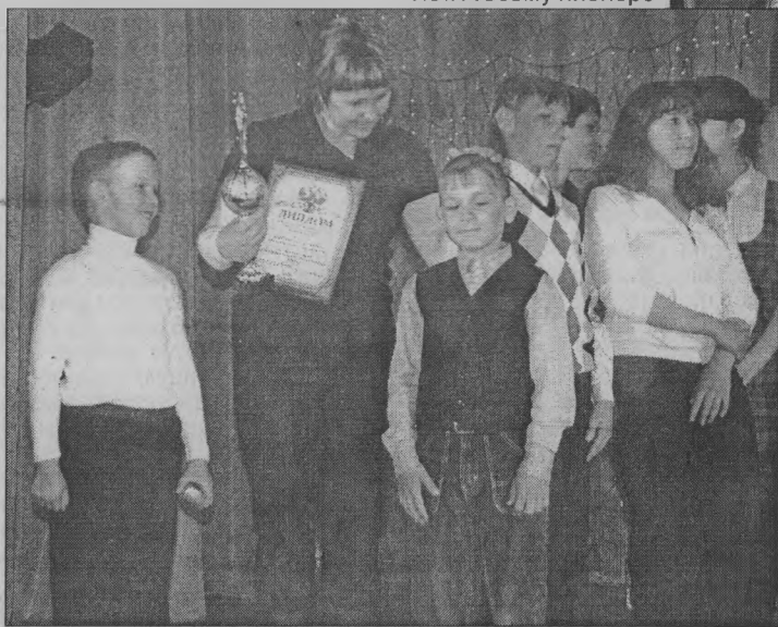
◆ Умницы вы наши!

сцену взрослые поздравляли детей с их успехами, выражали им благодарность и просто хвалили за труд и усердие.