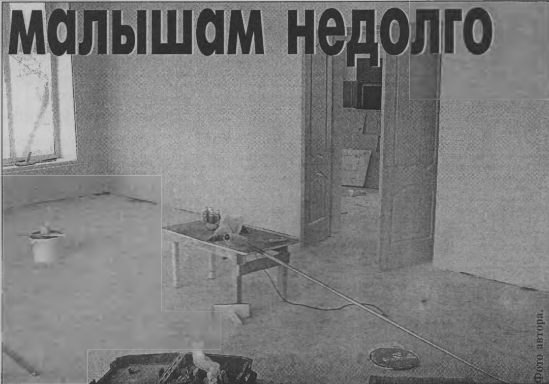
◆ Еще две недели назад в новой группе не было даже полов, а сейчас ремонт близится к завершению.

В результате ремонта в этих детских садах появятся дополнительные места: в «Аленушке» 20 мест для детей дошкольного возраста и в «Малыше» 15 мест для детей от года до двух лет, благодаря чему в районе уменьшится очередь