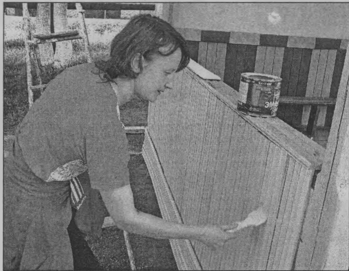
◆ Работники детского сада принимают участие в ремонте - своими силами подновили старые веранды.

на устройство детей в детские сады. По программе не используемые по назначению помещения, бывшие когда-то игровыми, спальными комнатами, будут приведены вновь в помещения для пребывания детей с учетом требований СанПиНа, Госпожнадзора и правил техники безопасности. Для новых групп будет приоб-