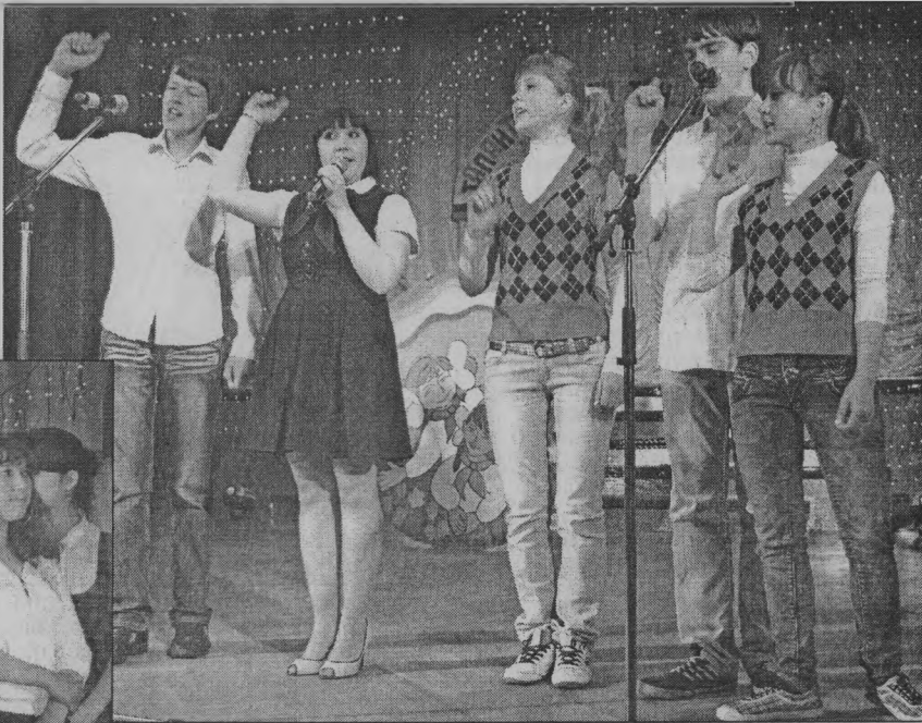
◆ Из «Искорки» возгорится пламя.