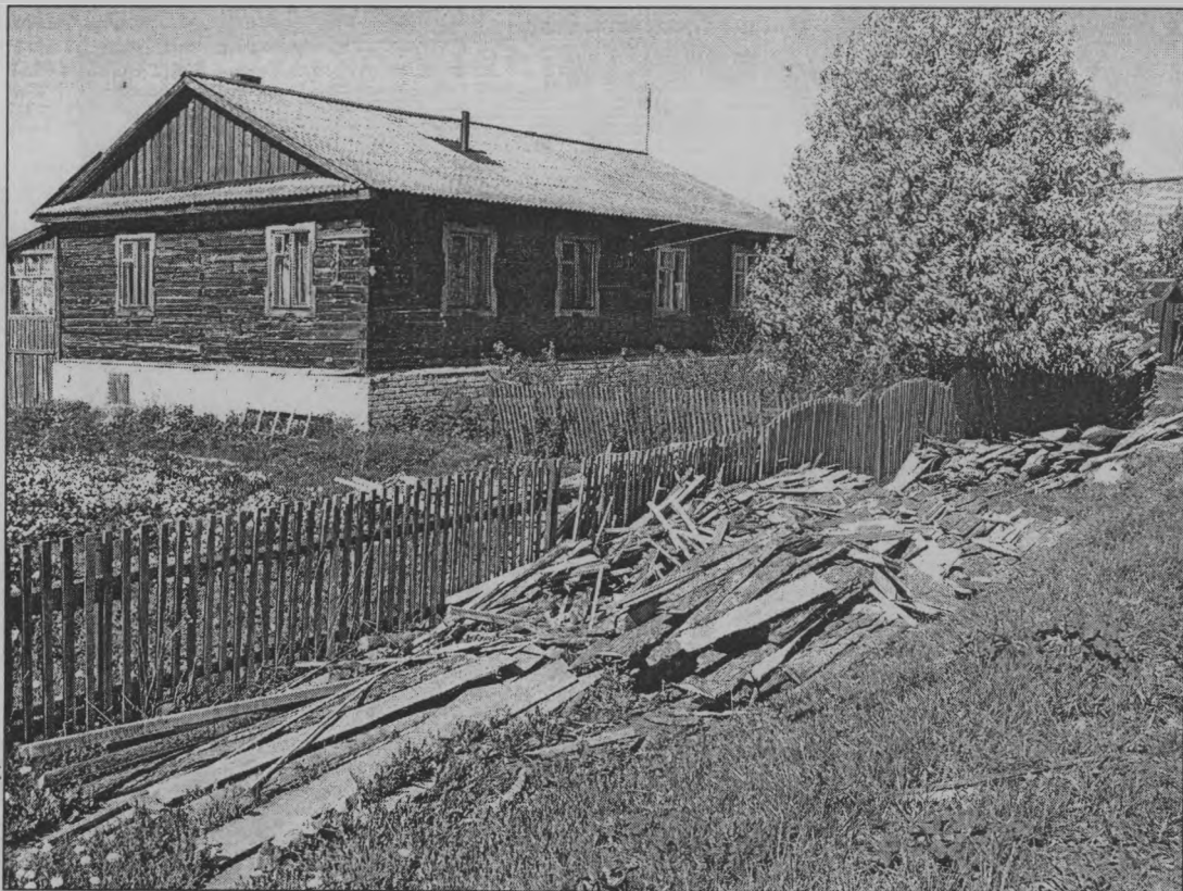
◆ Луговской пейзаж.