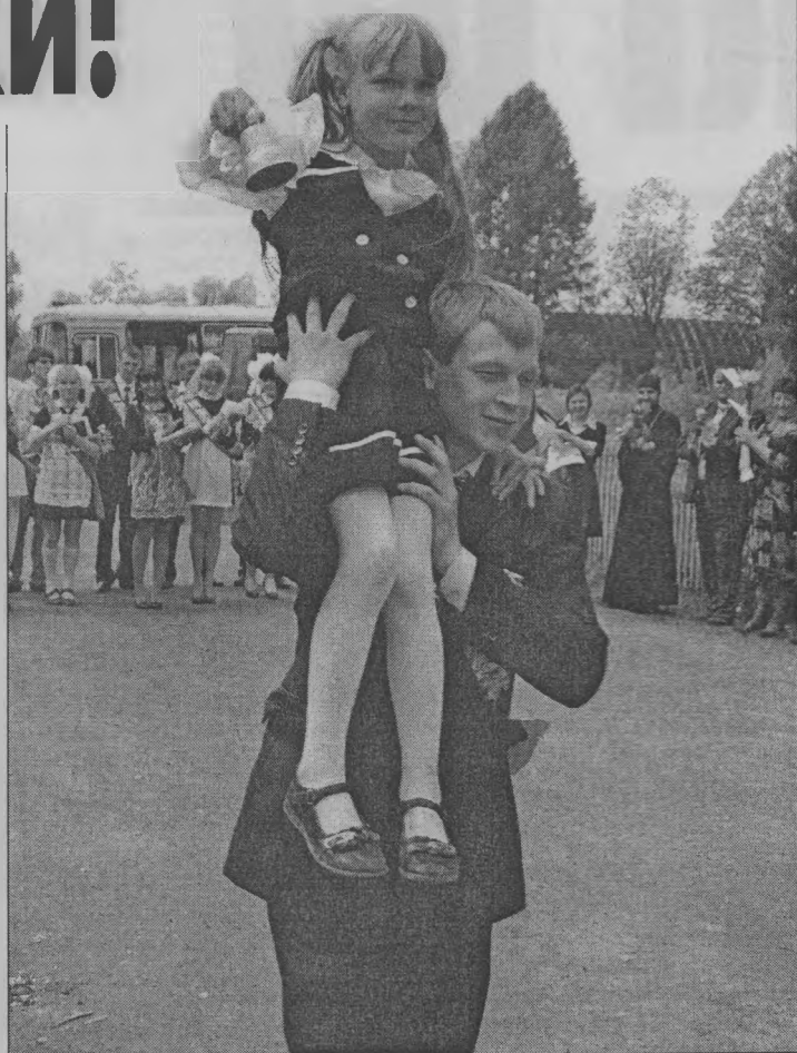
◆ Колокольчик, день-день-день...