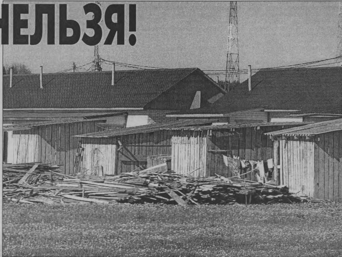
◆ «Задворки» ул. Победы.

ную деревню? Хочется сказать: люди — если вы даже не живете в деревне, а просто садите усадьбу — наведите у дома порядок, поправьте заборчик, приберите дрова. Каждый день этот унылый пейзаж виден из окон проезжающих автобусов, машин, и, наверное, кроме тоски, никаких других чувств не вызывает. Так жить нельзя!