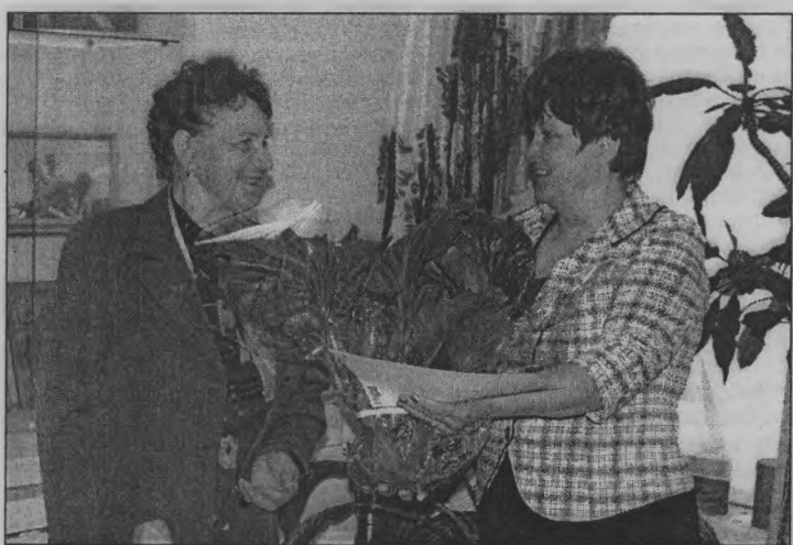
◆ Лучший подарок от цветовода.