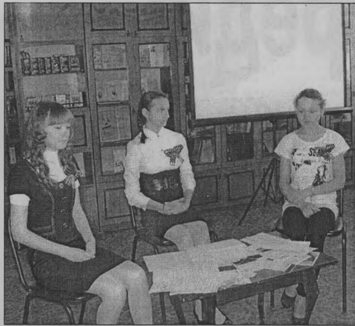
◆ На уроке памяти.

Но немало было и похоронок. Несколько были также зачитаны.