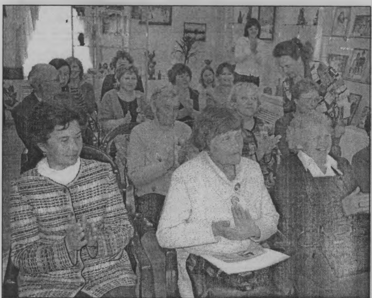
◆ В День дарения отличное настроение!

В Международный день музеев в нашем краеведческом музее, как и во всех этих учреждениях культуры, были распахнуты двери для всех желающих. Абсолютно бесплатно!