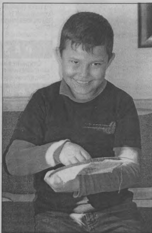
◆ Мальчики вышивают.