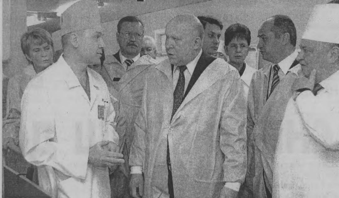
◆ Валерий Шанцев всегда внимательно выслушивает мнение профессионалов.

Сосудистые центры были открыты по инициативе партии «Единая Россия» в рамках программы «Совершенствование оказания медицинской помощи больным с сосудистыми заболеваниями» с общим объемом финансирования 408,2 млн. рублей. Также партия добила выделения для Нижегородской области из федерального бюджета 8 млрд. рублей на ближайшие 2 года на реализацию проекта «Качество