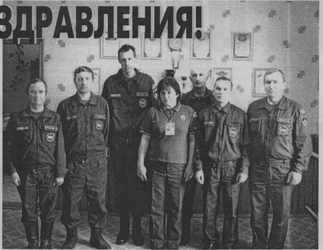
◆ Мы готовы прийти на помощь.

Однако пожары остаются самой частой и разрушительной техногенной катастрофой. И нашей важнейшей задачей является предупреждение по-