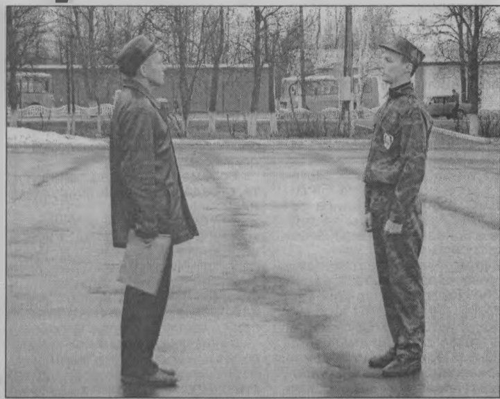
◆ «Рапорт сдан!» - «Рапорт принят!»

чишки и девчонки превратились в пожарных и разведчиков.