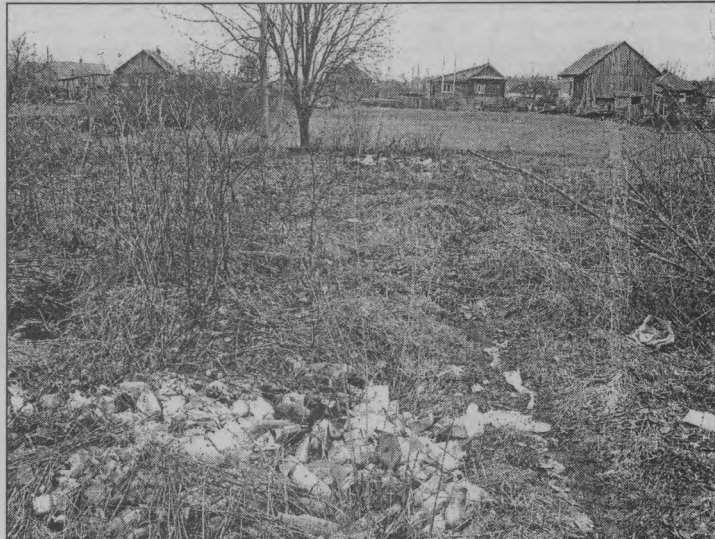
◆ Такая свалка на территории поселка не единственная.

А для того, чтобы во время субботников вывозка мусора прошла организованно, разрабатывается новый график закрепления территорий за предпринимателями и предприятиями поселка. Он будет опубликован в газете, и во время месячника по уборке и санитарной очистке жители могут обратиться за помощью в те орга-