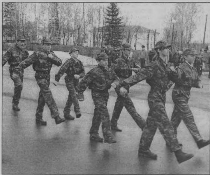
◆ «Раз-два, левой!»

Далее кто пошел отвечать на вопросы викторины по истории