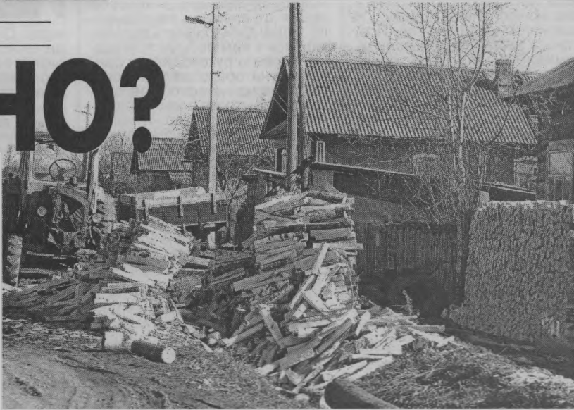
◆ Безобразия, однако...