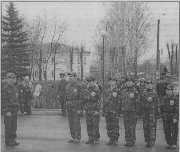
◆ «Отряд, равняйся! Смирно!»