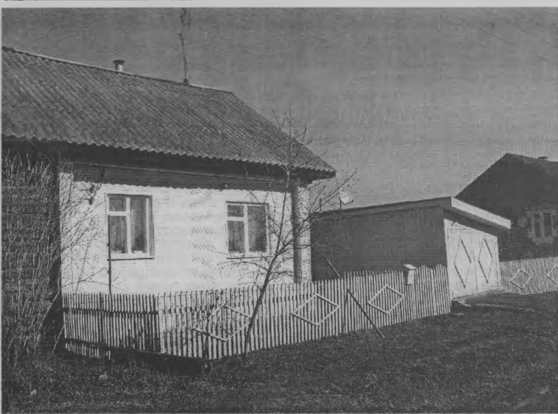
◆ Любо-дорого посмотреть.