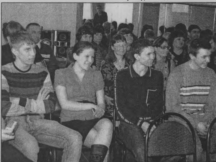
Спортивная молодежь п. Пижма.

- Ситуация складывается так, что дети ищут вину в родителях, родители – в детях. Чиновники ругают простых людей, простые люди – чиновников. Но только мы сами можем привнести изменения в лучшую сторону своей культурой и делом. И возни-