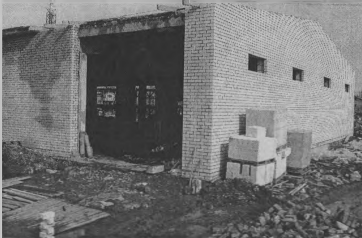
◆ Строительство второй очереди бизнес-инкубатора.

В результате успешного выполнения всех намеченных планов объем капиталовложе-