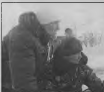
◆ Судьи строги, но справедливы.

И вот в этом году на старт вышли уже 43 участника в возрасте от 8 до 63 лет. Было подготовлено 25 грамот от администрации посёлка, которые призёрам и победителям