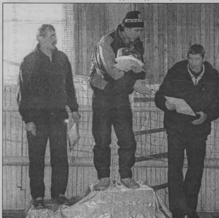
◆ На пьедестале ветераны.