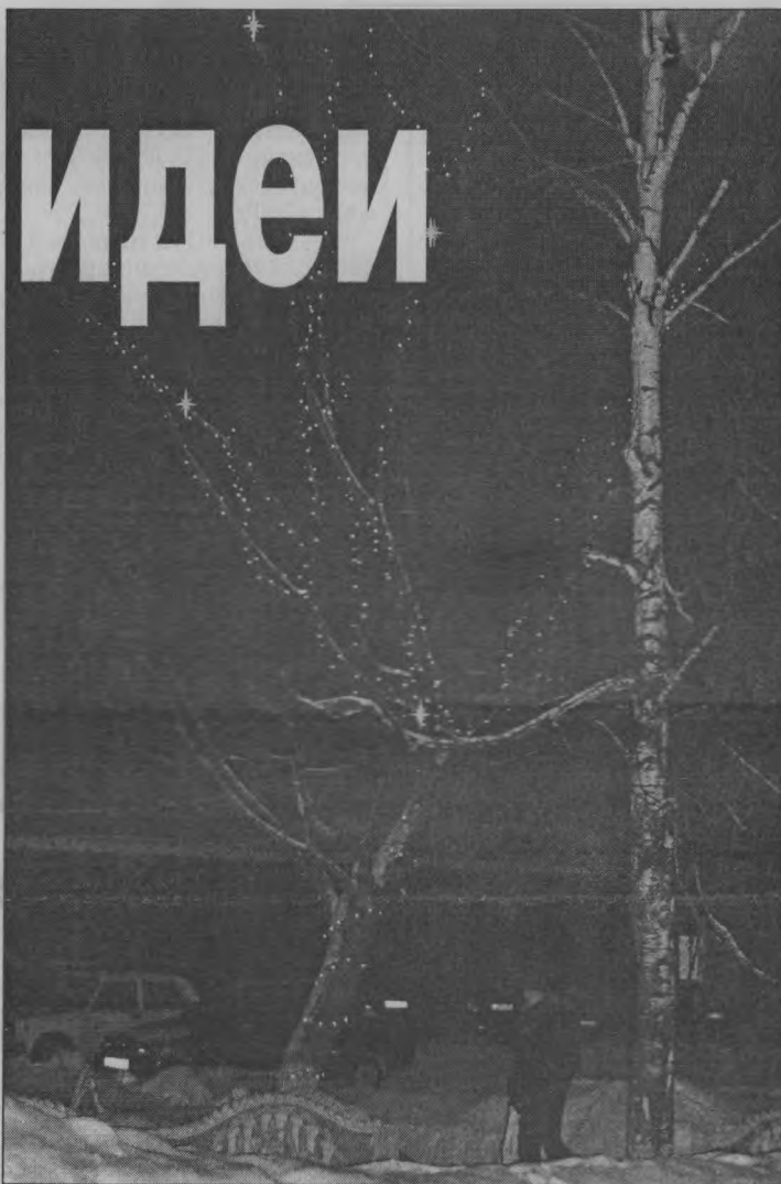
◆ Зажигают огоньки...

Пожелаем же друг другу, чтобы к следующему Новому году наше Тоншаево стало еще краше, чтобы у нас появилось еще больше свежих идей по оформлению наших зданий и чтобы мы не забывали подавать заявки на участие в этом конкурсе. Ведь пусть даже поощрительная денежная премия лишней не будет. А мы все будем видеть эту красоту и радоваться. И хорошее настроение не покинет больше нас.