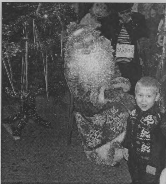
◆ «А стишок Деду Морозу?»

Детям были вручены новогодние подарки от администрации и мягкая игруш-