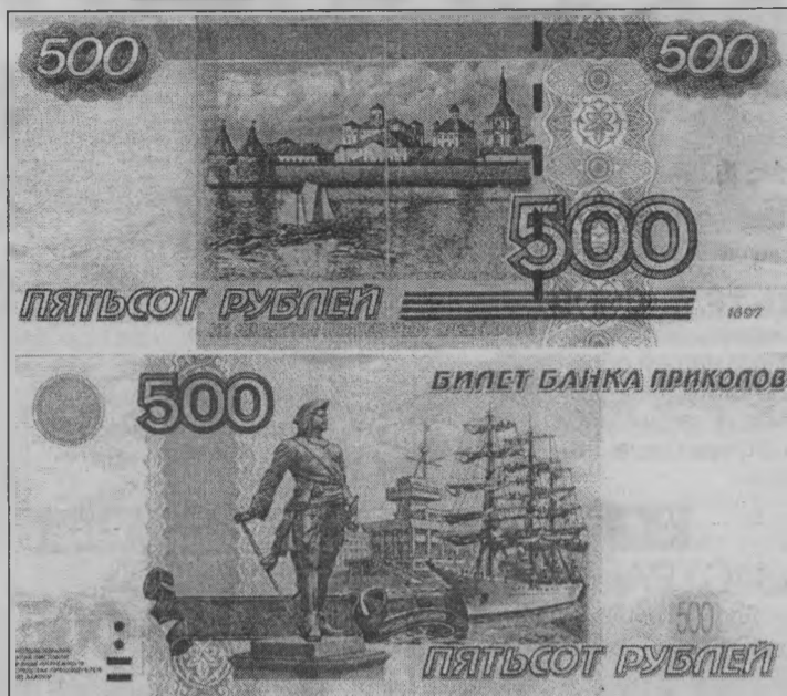
♦ В правом верхнем углу купюры есть надпись «Билет банка приколов». Это закладка, а не деньги!

Часто обманывают стариков, используя старый испытанный метод - под видом обмена денег. Только сейчас предлагают закладки «Банка приколов», а не поддельные купюры.