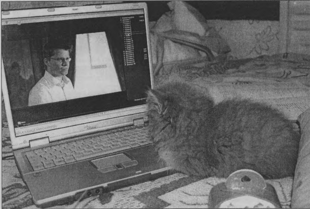
◆ «И чего ожидать от этого Бульдога?»