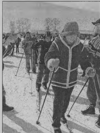
◆ Стартуют женщины.

Нынешние состязания собрали более 50 человек, имеющих тягу к здоровому и активному образу жизни. Они приехали из Селков, Шайгино, Пижмы. Прошли гонки при солнечной погоде. И на хорошей лыжне, которую всегда в полном порядке содержит спортивная школа. Стартовали дети 10-11 лет и взрослые, чей возраст перевалил за 60 лет. Нельзя не отметить педагогов Тоншаевской средней школы, которые проявили небывалую численную активность. И женщин из Селков, можно сказать, постоянных участниц подобных мероприятий. А еще, конечно же, ребятшек, их было преобладающее большинство. Уверена, каждый, кто побу-