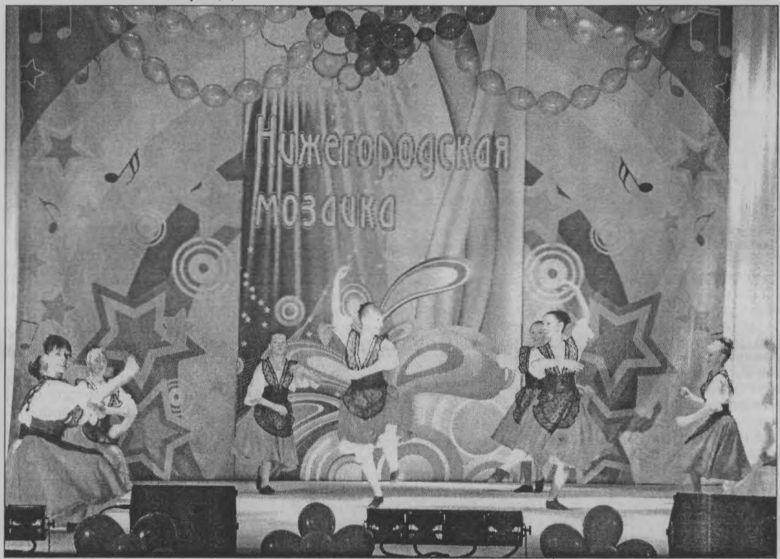
«Арагонская хота» в исполнении «Счастливого детства».

«Звездочки» представили композиции: «Наша жизнь — танец» и «Стрит денс» в номинации «Эстрадный танец».