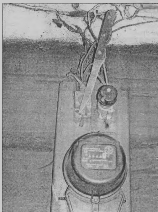
◆ Взамен эл. пробки - нож.