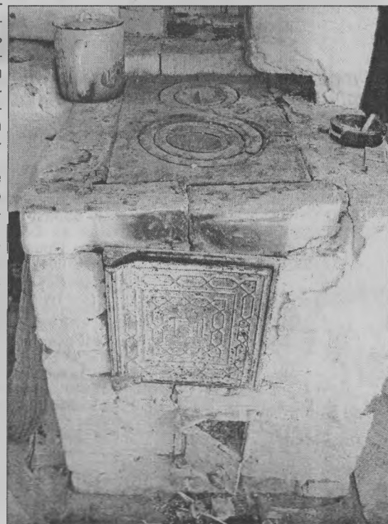
◆ Требуется ремонта.

ли претензии. Сделать это придется, потому что рейдовая бригада на этом свою работу не завершает.