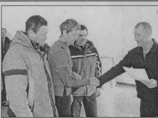
◆ Призеры соревнований.