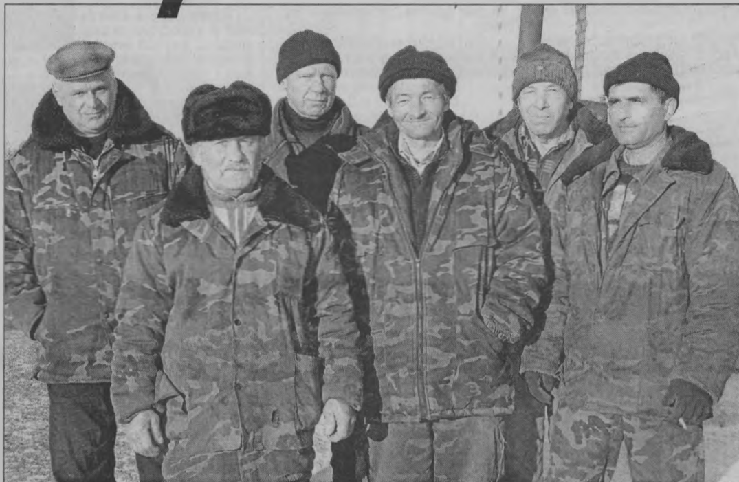
◆ Надежный коллектив механизаторов.

Конечно, нет. А основа - это коллектив, причем сплоченный и надежный. В наш коллектив пришли именно те люди, которые приняли решение работать в новом хозяйстве «Луговской». Особую роль в формировании коллектива сыграл