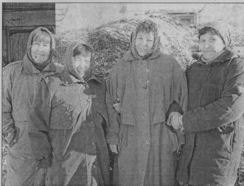
◆ Наши славные животноводы.