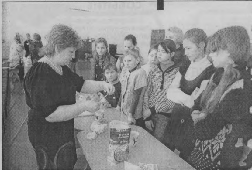
◆ «Соленое тесто замесили, теперь будем лепить...»