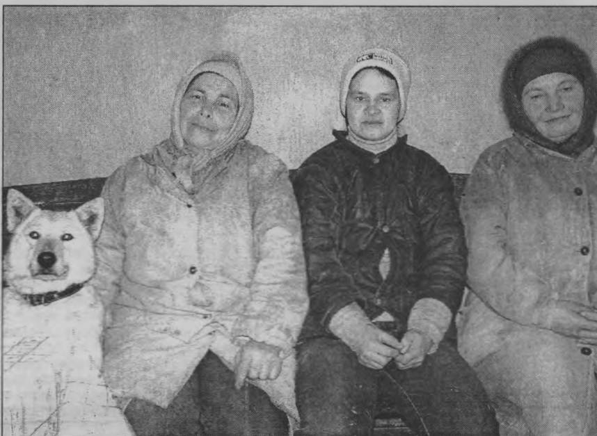
◆ Кувербские животноводы.

Сомнений нет: в этом хозяйстве все под контролем, зимовка идет и завершится нормально. Животноводы - старательные и добросовестные, корма есть,