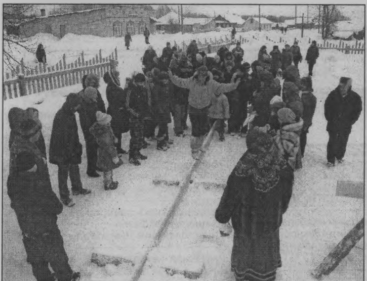
◆ Пройди, не упал!