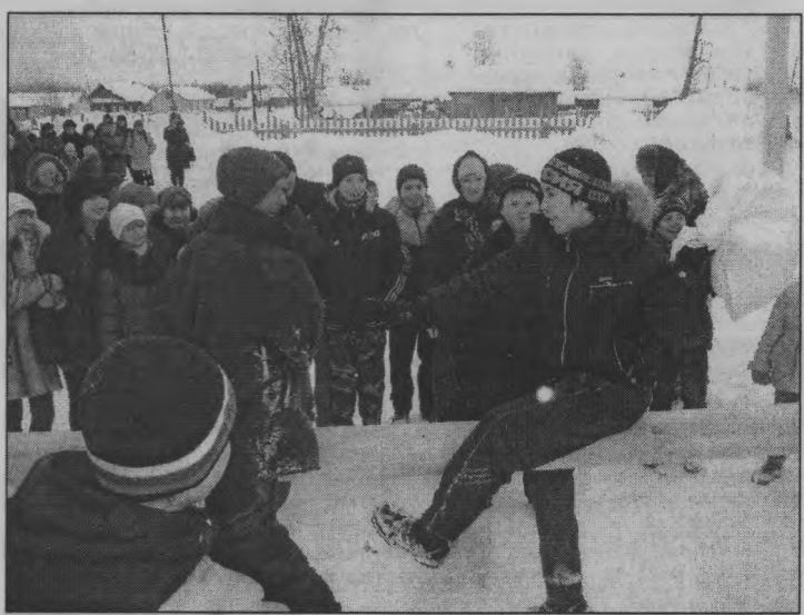
◆ Размахнись, рука, развернись, плечо!

Очень жаль, что не удалось в этот год взять главный приз со столба. Может, охотников было не так уж много, а может, зада-