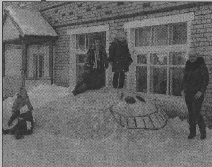
◆ К нам приплыл веселый кот.