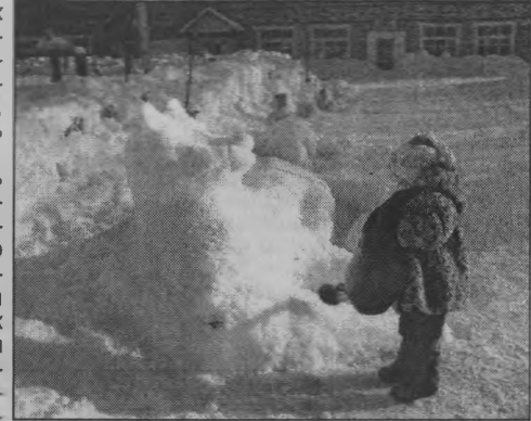
◆ Теперь снег будет лепиться.

Дети на прогулке с удовольствием играют в различные