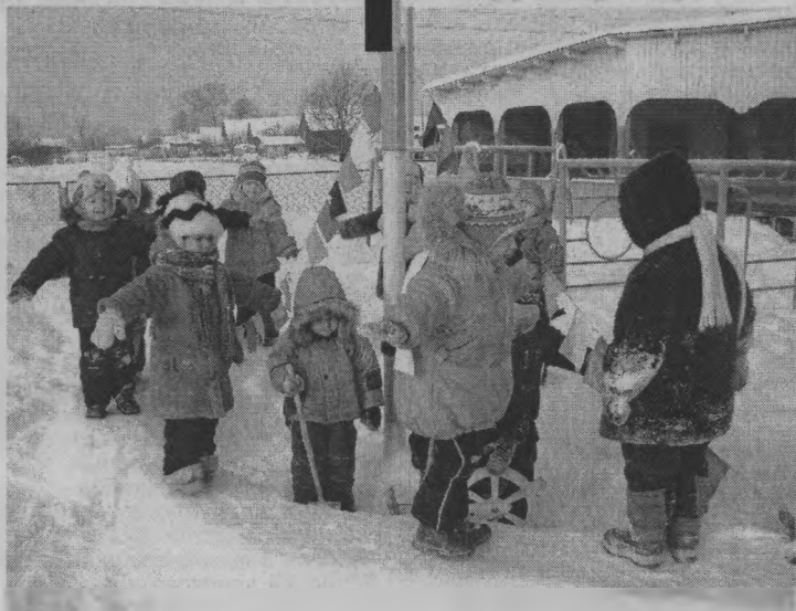
◆ На ледяном кораблике.

Этот детский сад расположен на центральной улице поселка Пижма, и все, что появляется на его площадках, находится у всех на обозрении. А ледяной красоты, привлекающей внимание, этой зимой было построено очень много! Первыми появились Дед Мороз и Снегурочка, они перебрались сюда из старого детского сада и заняли по традиции свое место у входа. Сейчас, конечно, их уже нет, но ими можно полюбоваться на фотографиях. Затем площадки для прогулок заселили осьминог, заяц, котенок, снеговик, появились крепости, ворота для подлезания, горка, машина, кораблик, лабиринт. Например, снеговик держит в руках деревянную кормушку. Вот и решение, как и где разместить зимой кормушку для пернатых друзей. Привлекает внимание