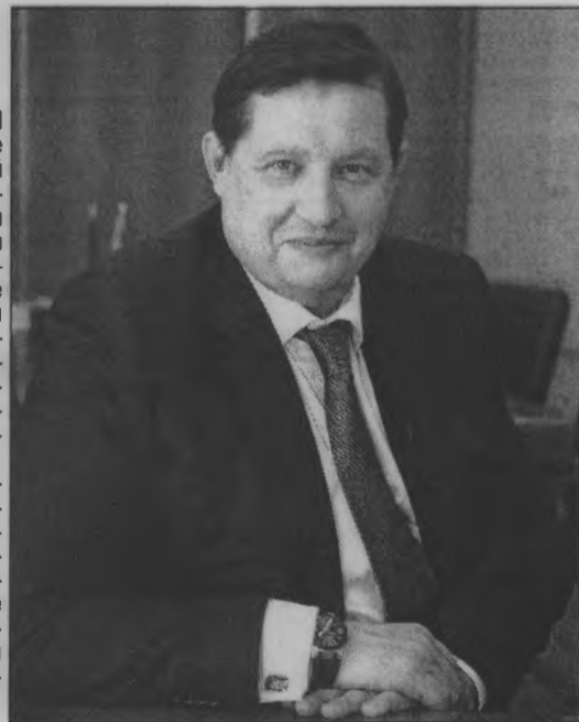
Оплачено из средств избирательного фонда кандидата.

борных встреч. Я не смею даже мечтать о той теплоте и симпатии, с которыми вы принимали меня в своих районах. Я искренне признателен вам за доверие, с которым вы относитесь к моим словам, моей работе, моей репутации. Уверю вас, что в жизни настоящего мужчины вряд ли что-нибудь есть ценнее этого. Поэтому я не могу себе позволить потерять вашу веру и при каких обстоятельствах.