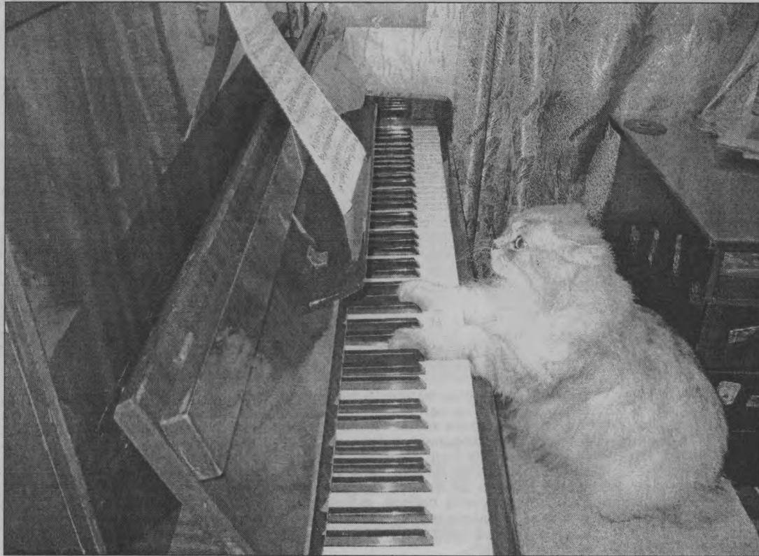
◆ «Играй, музыкант!»

Снимки лучше приносить на электронных носителях.