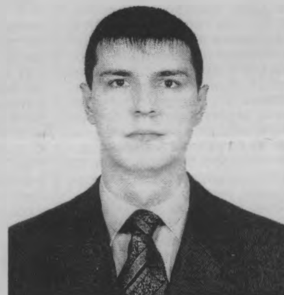
Размещено на бесплатной основе.