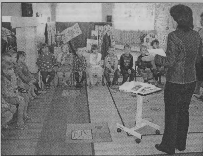
◆ «Поговорим о Родине».