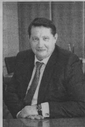
лагаю продолжить наше с вами общение в том же режиме и ритме.

А можно простым диалогом, открытым и правдивым. Разъяснением собственных взглядов и позиций, убеждений и стремлений. И сделать это просто: через личные встречи, через беседу «глаза в глаза», через прямые вопросы и искренние ответы. Это мой стиль работы. Именно этим я сейчас и занят. Я стараюсь встретиться с каждым из вас лично, а с кем не получается – попробую пообщаться через страницы этой газеты. Спасибо за то, что приходите. Спасибо за то, что слушаете и слышите. Пред-