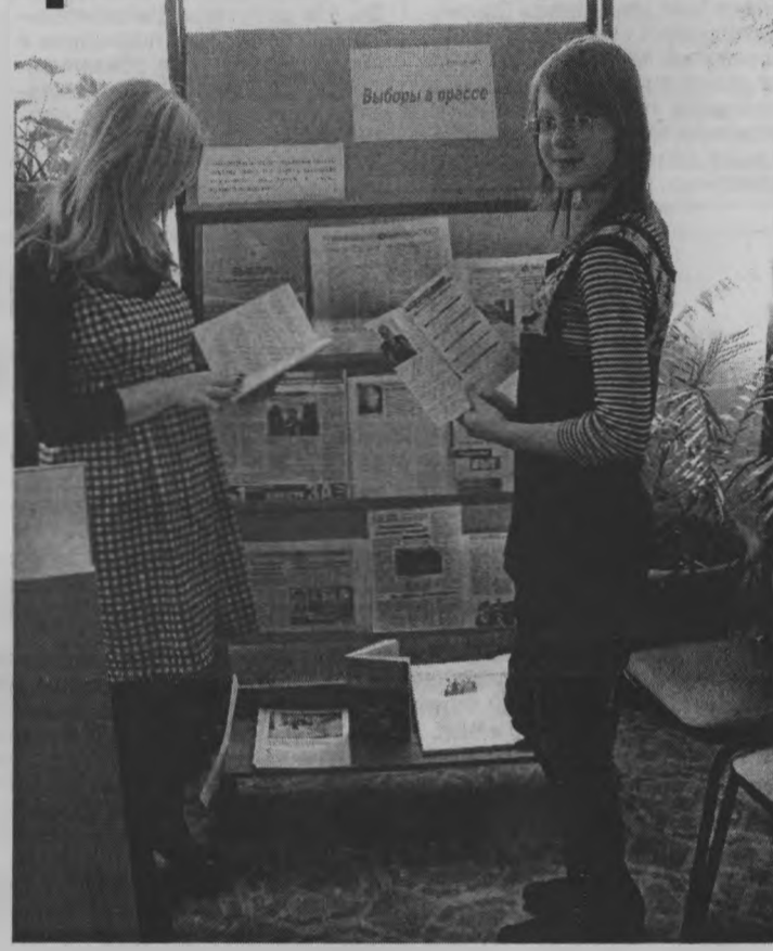
«А что у нас пишет пресса?»