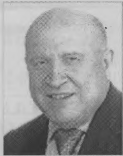
ШАНЦЕВ Валерий Павлович, губернатор Нижегородской области