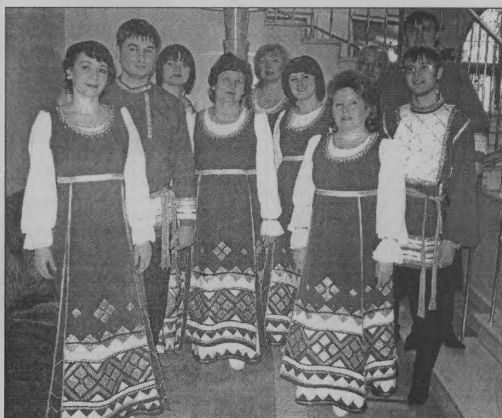
◆ После удачного выступления.

«Родным напевам» вручен диплом и памятный подарок -