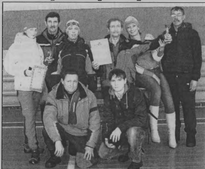
◆ Призеры первенства.

ных соревнованиях в Верхошижемье и первенстве Нижегородской области среди ветеранов.