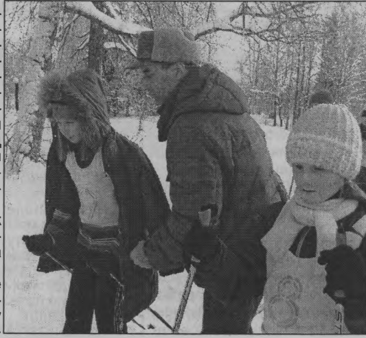
◆ Перед стартом.