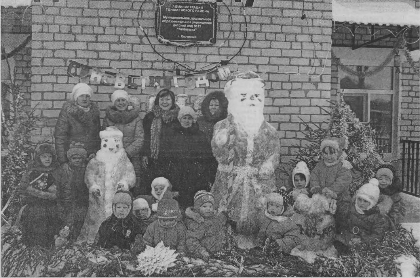
«А к нам уже пришли Дед Мороз и Снегурочка!»

- Ой! Как красиво! – восхищались утром 22 декабря жители п. Кировский, проходя мимо детского сада.