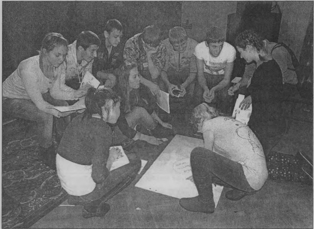
В районном Доме культуры состоялась школа молодого предпринимателя. Материал читайте на 3-й странице.