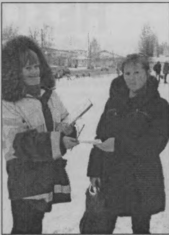
◆ «А это Вам памятка!»

Но девочки упорно продолжали свое дело. Несмотря на надвигающийся темный вечер и залепляющие глаза, нос, рот, лицо и оставляющие мокрые