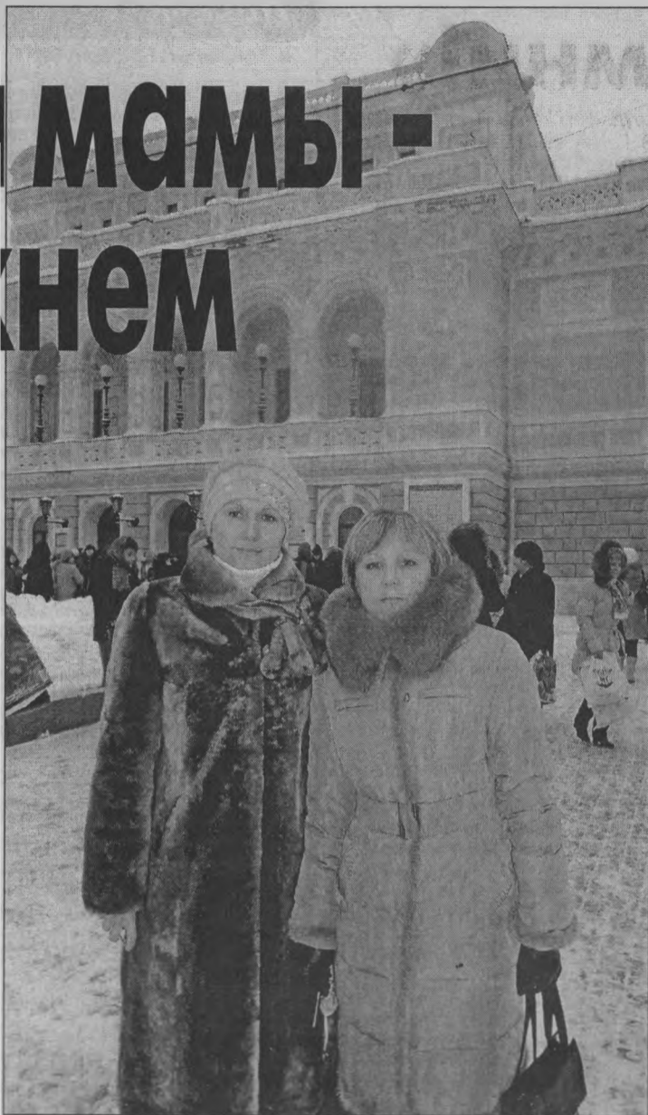
На память у драмтеатра.