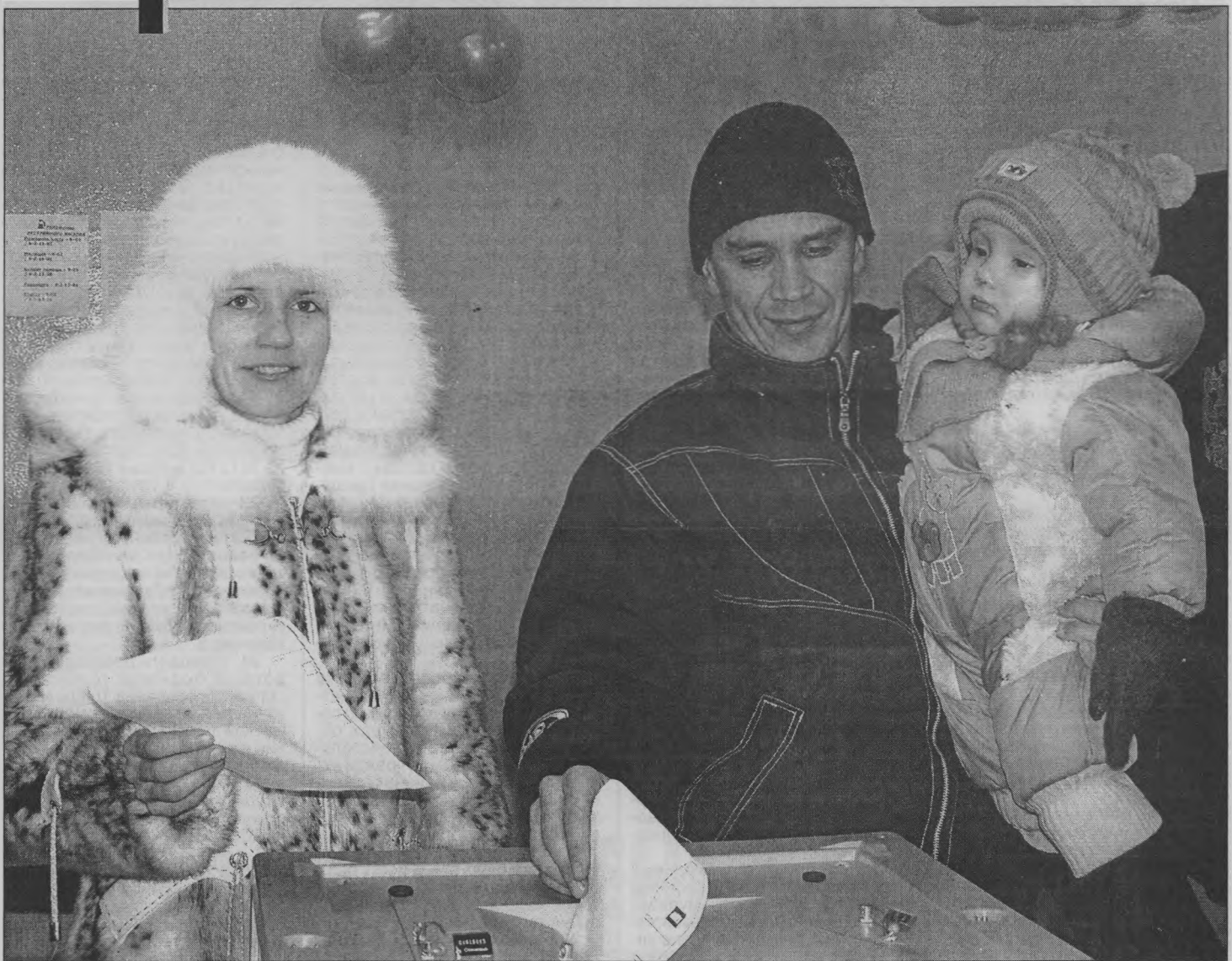
◆ «Голосуем за будущее своей семьи».

Всероссийская политическая партия «Правое дело» - 44 - 0,54%.