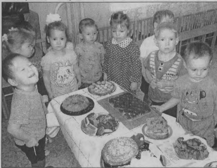
Ух, сколько сладостей!

В рамках празднования Дня матери в детском саду «Колосок» п. Тоншаево проходили различные мероприятия. Ребятушки вместе с воспитателями готовили виновницам торжества подарки, организовали выставки фотографий, рисунков, проводили развлечения.