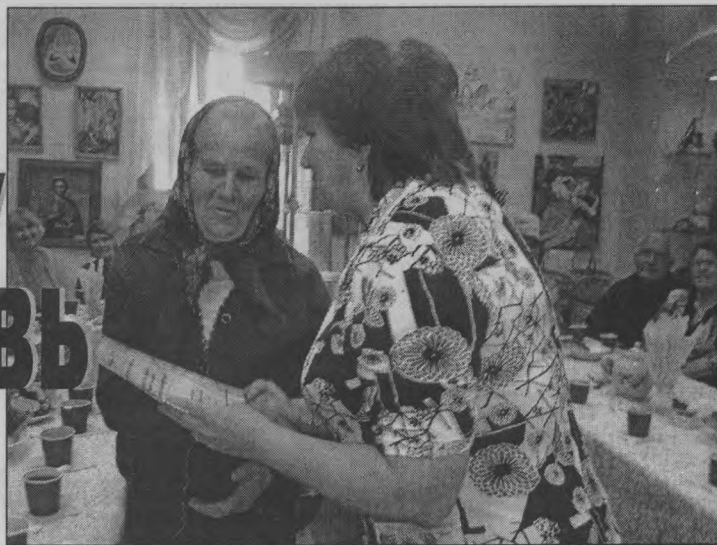
◆ За мастерство - Диплом.

Их встречали как самых дорогих гостей. Чаем угощали, приятные слова в их адрес говорили.