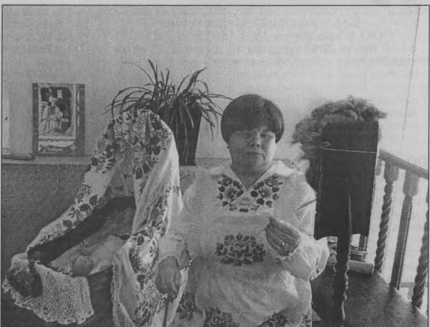
◆ Еще не забыто народное ремесло.