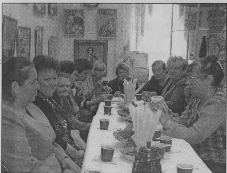
◆ Участницы выставки.

Здесь же, в музее, и состоялось ее торжественное закрытие, на которое были приглашены все 60 участников выставки, людей старшего поколения.