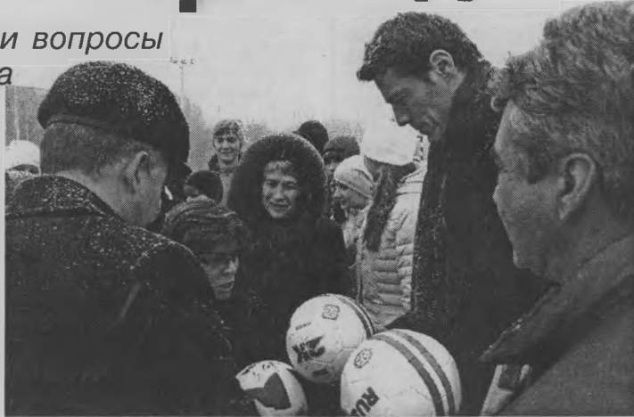
◆ М. Сафин и И. Роднина в школе № 128 Автозаводского района Нижнего Новгорода.

- Дети не должны бездельничать на улице, их надо увлечь делом, дворовым спортом, из которого выросли многие чемпионы, - уверена Ирина Роднина. - Я не в первый раз посещаю Нижегородскую область и точно знаю: здесь заботятся не