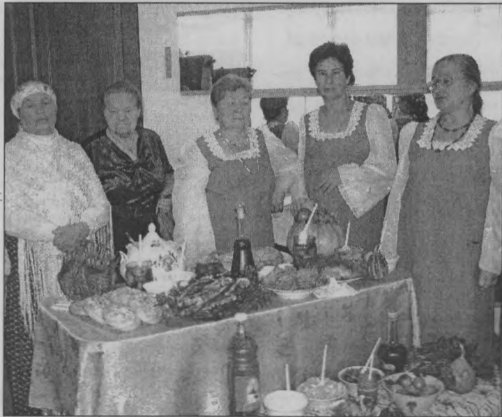
◆ Ждет гостей «Дубравушка».

Под таким же названием, что и в прошлый раз, в районном Доме культуры прошел фестиваль, в котором участвовали люди старшего поколения. Свой талант показать и на других посмотреть съехались ветераны со всего района. При этом они представляли какую-то сельскую, поселковую администрацию либо клуб.