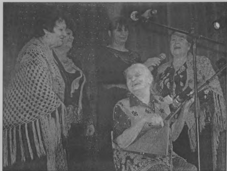
◆ На сцене - «Печки-лавочки».