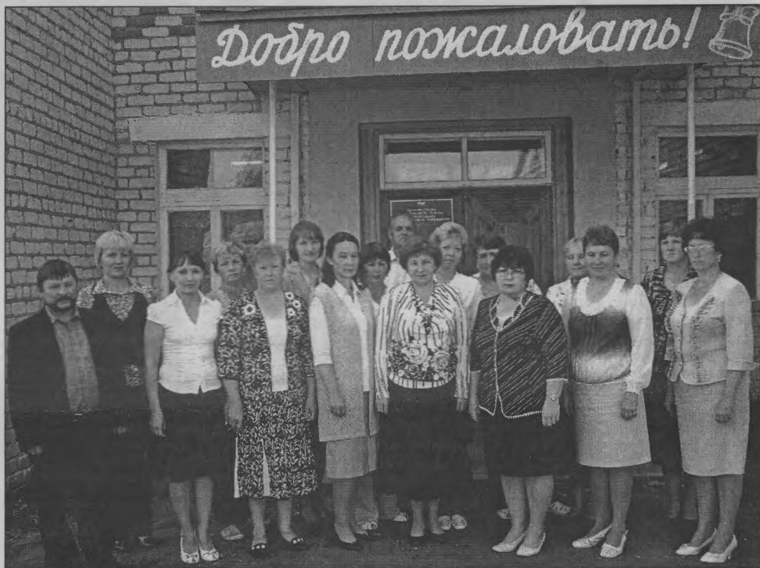
«Рады встрече с вами!»