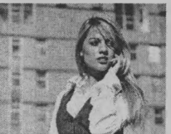
4.55 Сериал «МАНГУСТ»

5.55 «НТВ утром» 8.30 Сериал «ЭРА СТРЕЛЬЦА» 9.30 Чрезвычайное происшествие 10.00 Сегодня 10.20 Чрезвычайное происшествие 10.55 «До суда» 12.00 Суд присяжных 13.00 Сегодня 13.30 «Судебный детектив» 14.40 Центр помощи «Анастасия» 15.30 Чрезвычайное происшествие 16.00 Сегодня 16.25 «Прокурорская проверка» 17.40 «Говорим и показываем» 18.30 Чрезвычайное происшествие 19.00 Сегодня 19.30 Сериал «УЛИЦЫ РАЗБИТЫХ ФОНАРЕЙ» 21.30 Сериал «МОРСКИЕ ДЬЯВОЛЫ. СУДЬБЫ» 23.15 Сегодня. Итоги 23.35 Честный понедельник 0.25 «Школа злословия» 1.10 Главная дорога 1.45 «В зоне особого риска» 2.20 «Один день. Новая версия» 3.00 Сериал «ГОРОД СОБЛАЗНОВ»