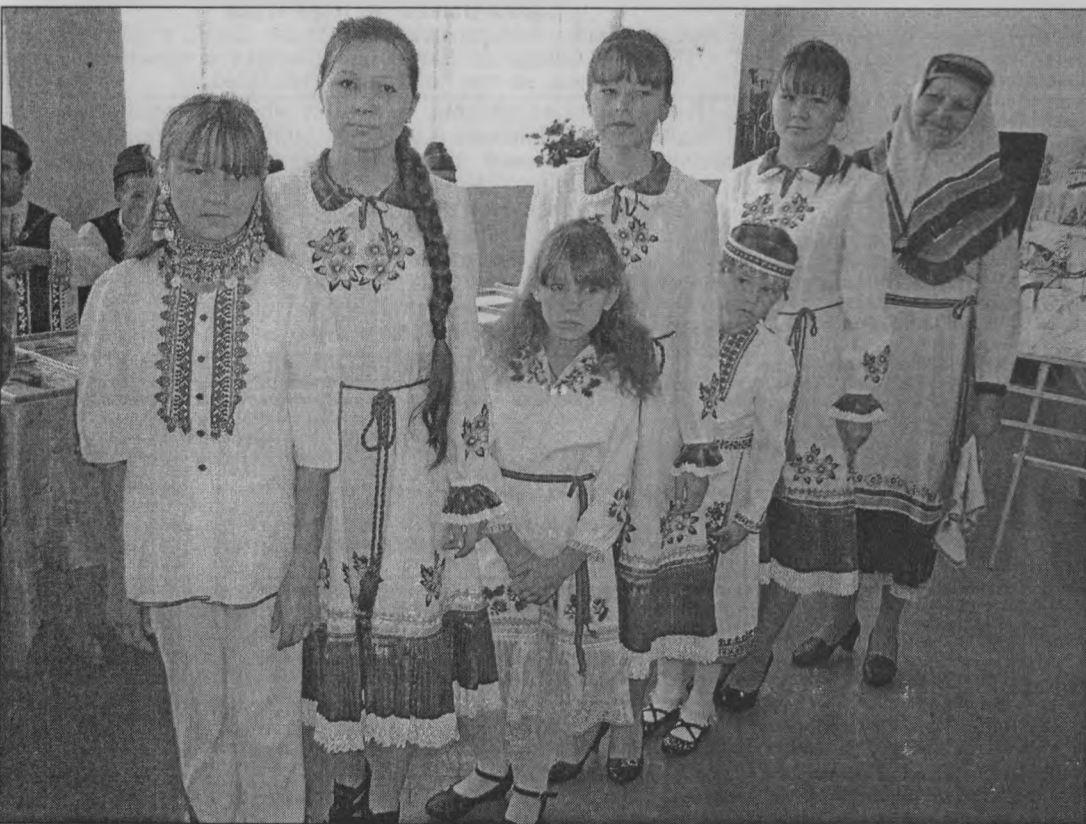
◆ Самая разновозрастная делегация - из Тонкино.