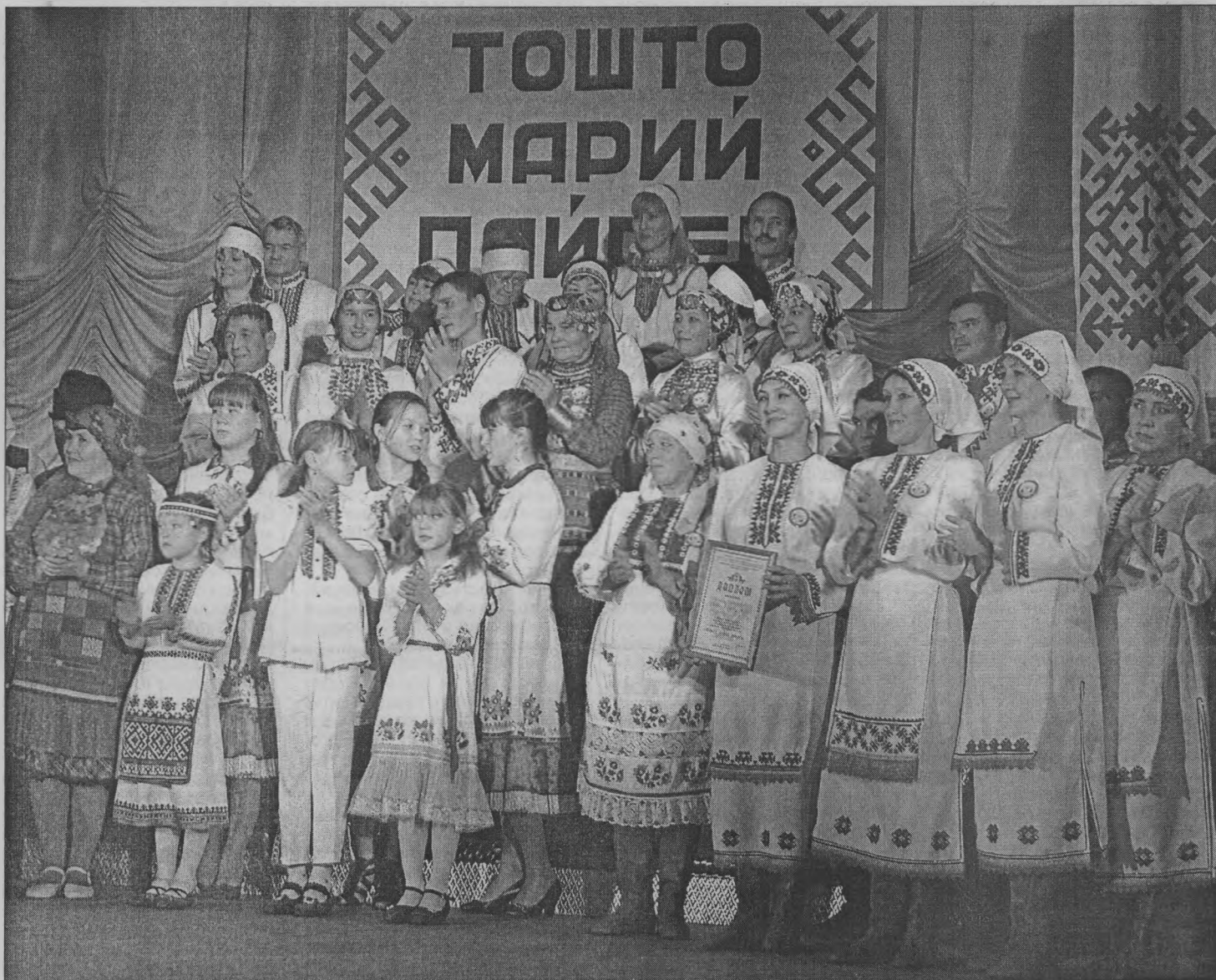
◆ В Тоншаевском районном Доме культуры прошел межрегиональный праздник марийской национальной культуры «Тошто марий пайрем». Репортаж о нем читайте на 3-й странице.