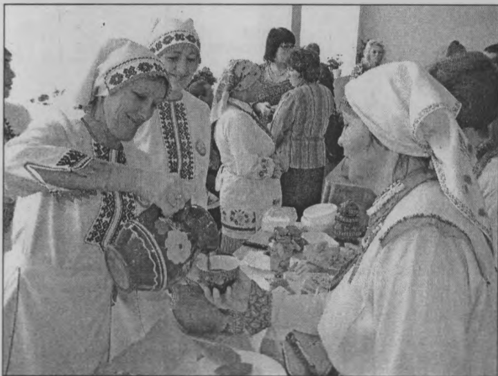
◆ Шаранга угощает квасом и блюдами национальной кухни.

алитета. «Тошто марий пайрем» в переводе означает «старинный марийский праздник», восхваляющий древние марийские традиции. С ними можно было начать знакомство еще до начала гала-концерта. В фойе на втором этаже были оформлены различные выставки. Центральная районная библиотека