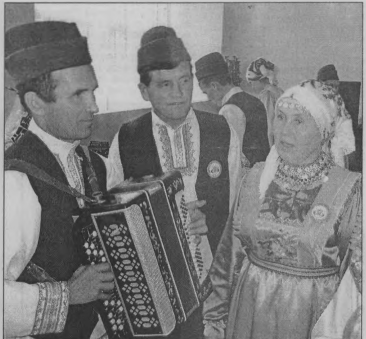
◆ Ансамбль из Татарстана готовится к выступлению.

- Марийский народ богат культурой, традициями, видами праздничества. Один и тот же