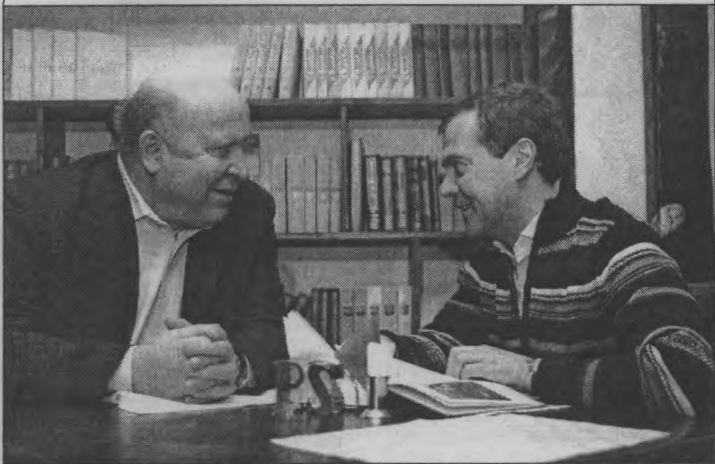
◆ Медведев отметил инновационный характер мышления Валерия Шанцева.

Нижегородская область вновь доказала, что обладает отличным научно-промышленным потенциалом. А кое-какие региональные наработки не грех и Президенту РФ Дмитрию Медведеву показать. Посмотрев на них, глава государства принял 31 января в Арзамасе на заседании комиссии по модернизации и техническому развитию экономики России решение о более тесной работе госкорпораций по внедрению инновационных технологий.