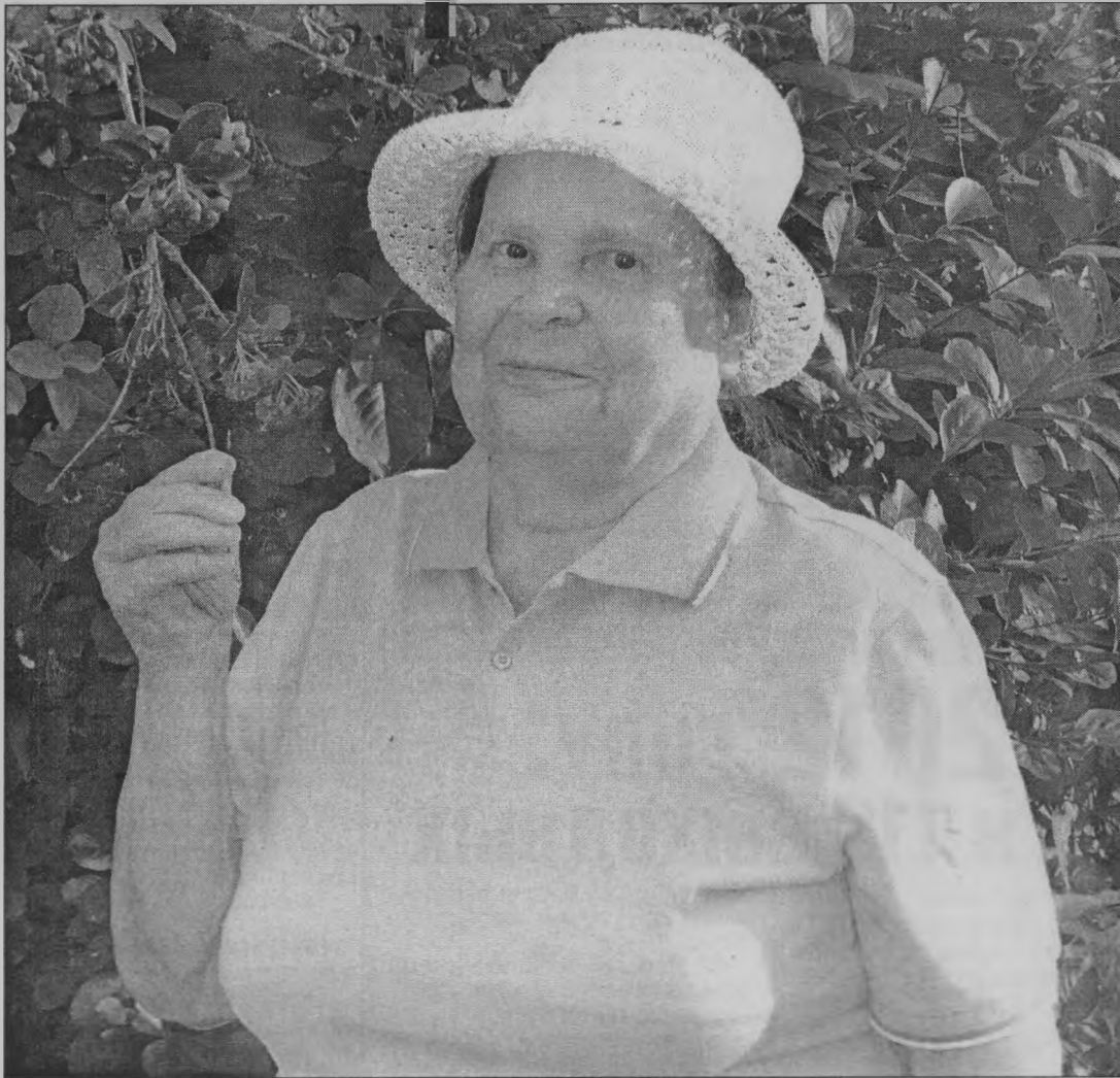
◆ В летние денечки в Тоншаеве.