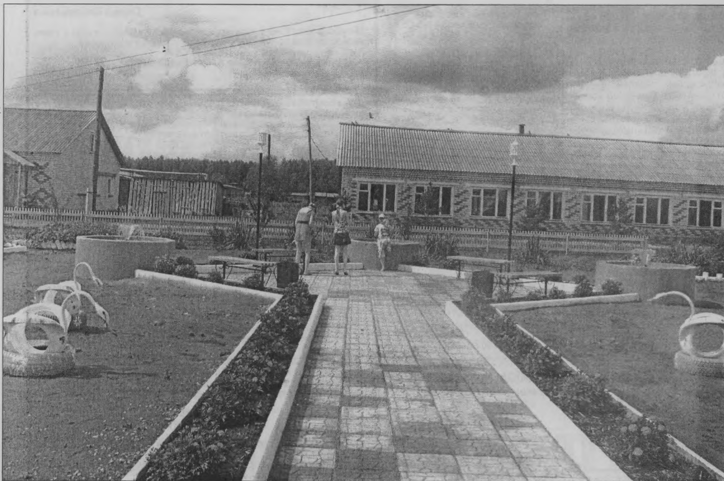
◆ Стараемся, чтобы был порядок вокруг, красота радовала глаз.

такие были деловые, решительные. Да все вначале было: и слезы, и сомнения. Но всегда поддерживал муж – и словом, и советом. А самое главное, убедил меня в том, что на работу нельзя приносить домашние проблемы. А домой – приходить злой и недовольной из-за работы. Это очень правильно – нельзя срывать зло на тех, кто рядом.