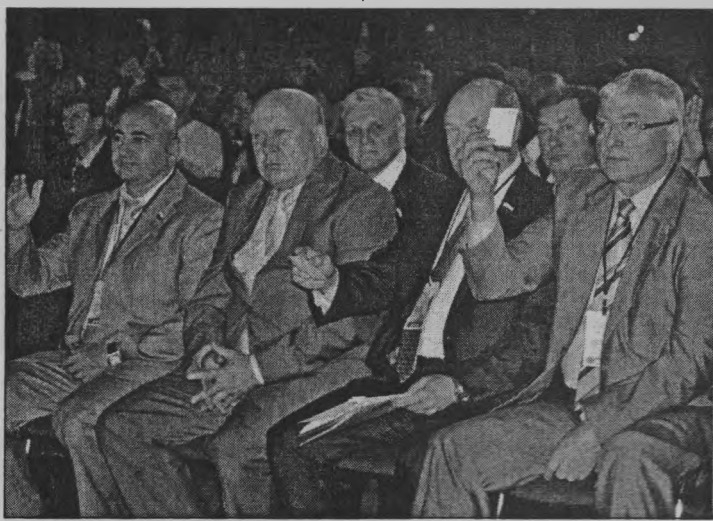
◆ Участники конференции.

Участники конференции избрали делегатов на 12-й съезд партии, который пройдет в Москве 23-24 сентября.