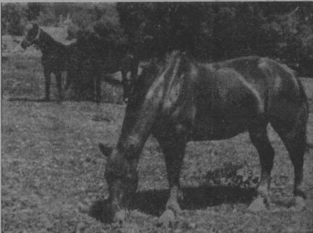
На лугу.