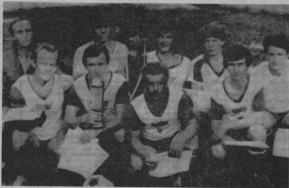
На снимке: Это уже история. Наш первый победитель

Но все же в этом турнире главное не победа, а участие. Так считают организаторы этих соревнований, ведь после весенних полевых работ надо немного и отдохнуть.