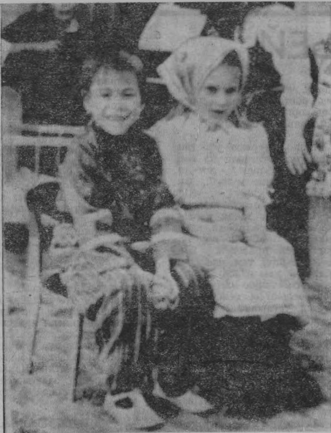
ФОТО РЕПОРТАЖ ПРАЗДНИК РУССКОГО ДОМА