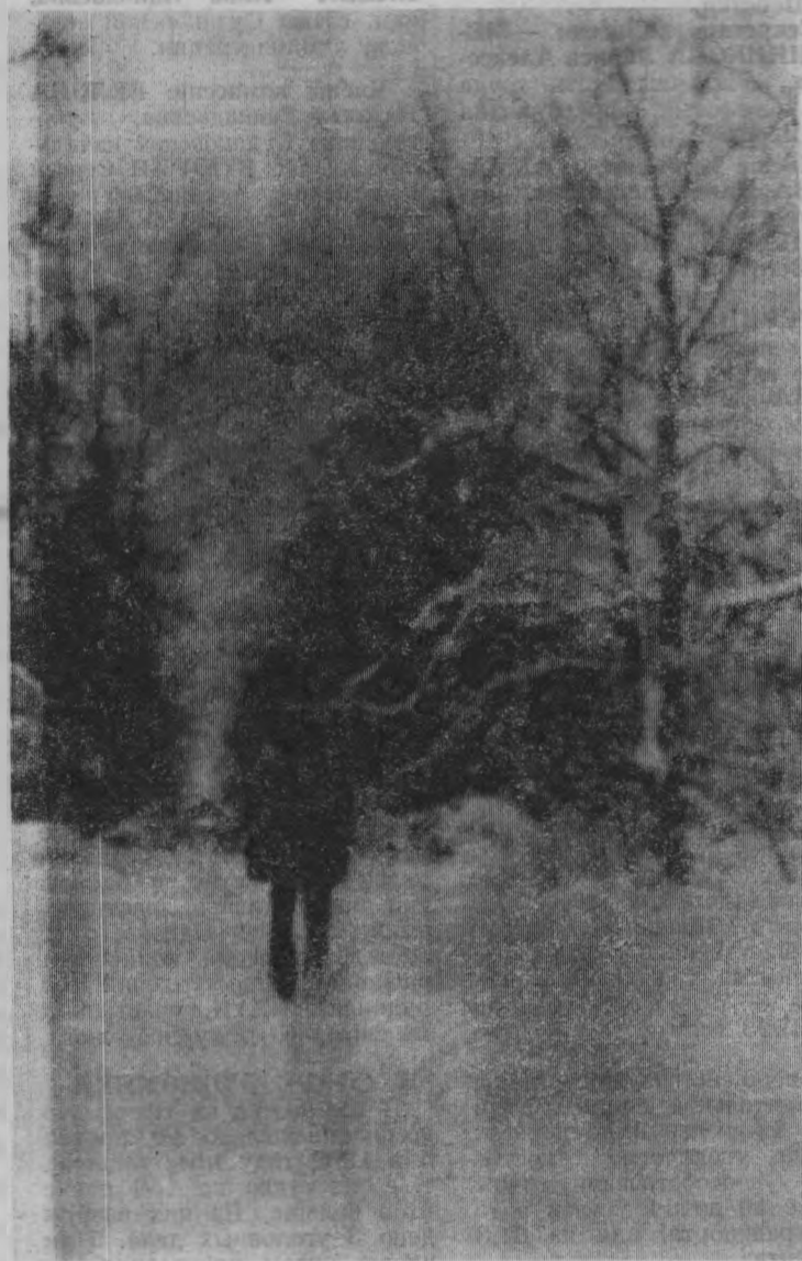
Просека возле деревни

Восход 7.52. Заход 17.37. Долгота дня 9.45.