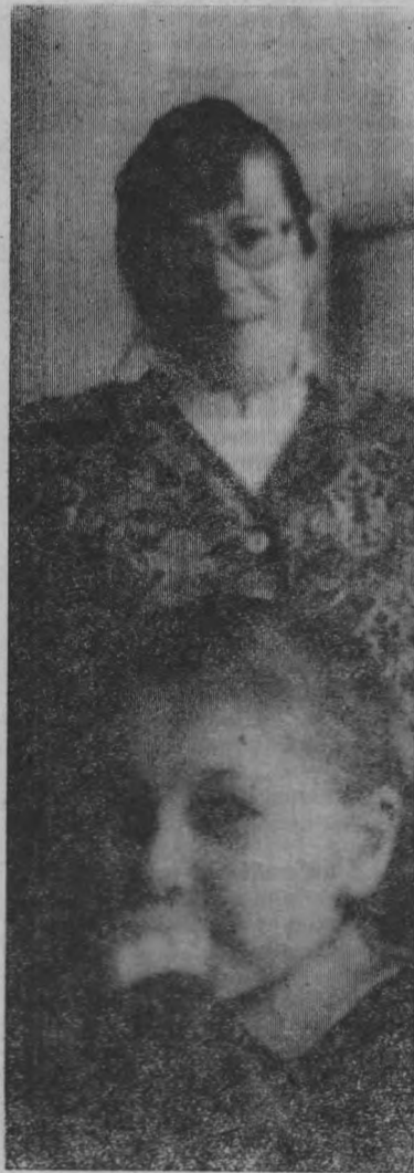
ные не только «принести с собой личность», но и сохранить ее в школе, преумножить.