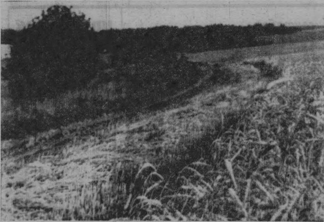
Уголок родной природы.