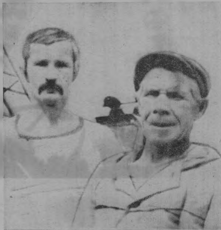
Самая крупная строительная организация района — Тоншаевская МСО ежегодно выполняет большой объем строительно-монтажных работ. И сегодня несколько бригад трудится на различных производственно-бытовых и жилых объектах.

Для того, чтобы успешно решать производственную программу нужны стабильные, квалифицированные кадры. Такие люди в МСО есть.