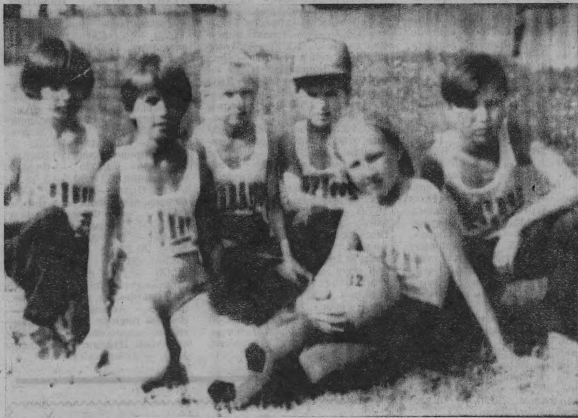
В футбол играют не только мальчишки.