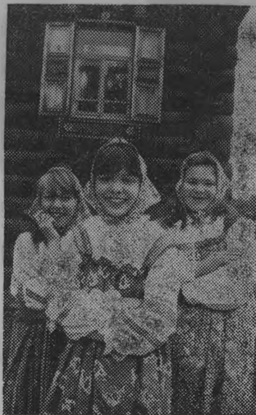
В Костроме прошел традиционный праздник «Русская песня, русская сила».

В музее народной архитектуры и быта, что находится под открытым небом возле Ипатьевского монастыря, собрались фольклорные коллективы из разных областей России. Здесь звучали русские народные песни, баллады, частушки. Рядом по традиции раскинулся «Город мастеров», где умельцы представили свои работы.