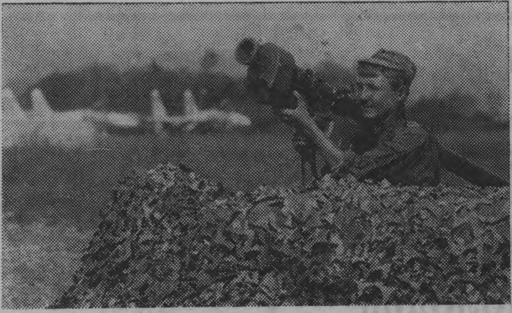
С самого начала грузино-абхазского конфликта Российская десантная дивизия несет службу по охране аэродрома в городе Гудаута.

На снимке: будни солдат-россиян в Абхазии.