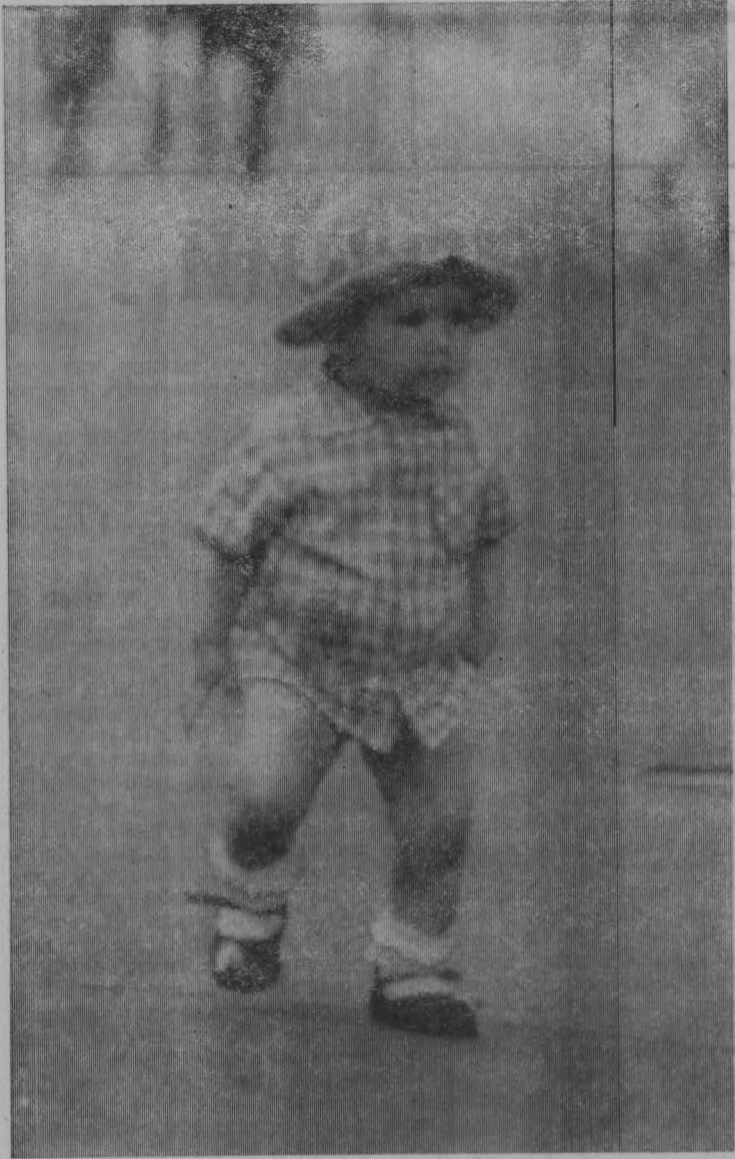
Первые шаги.