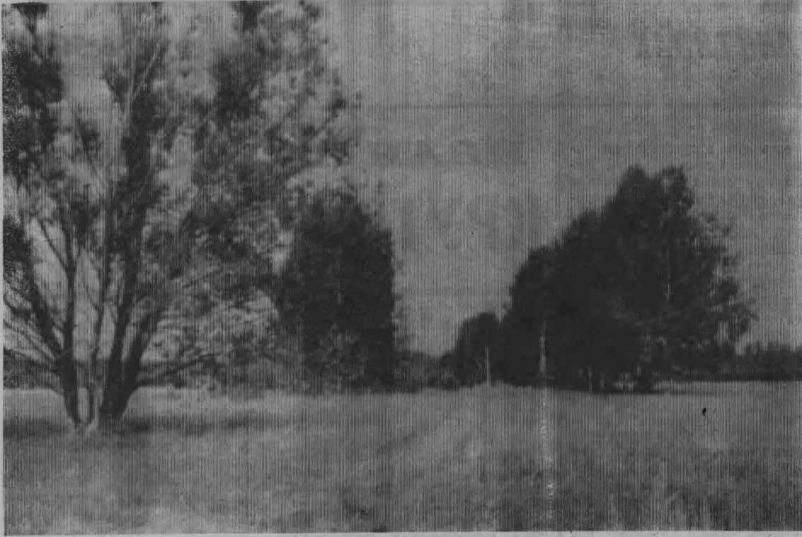
Одинокaя верба.