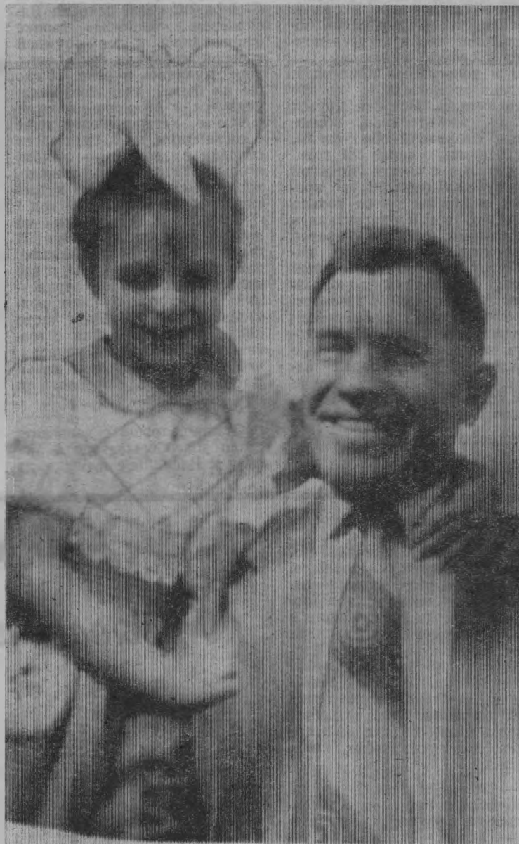
ВETERАН ВОЙНЫ И ТРУДА