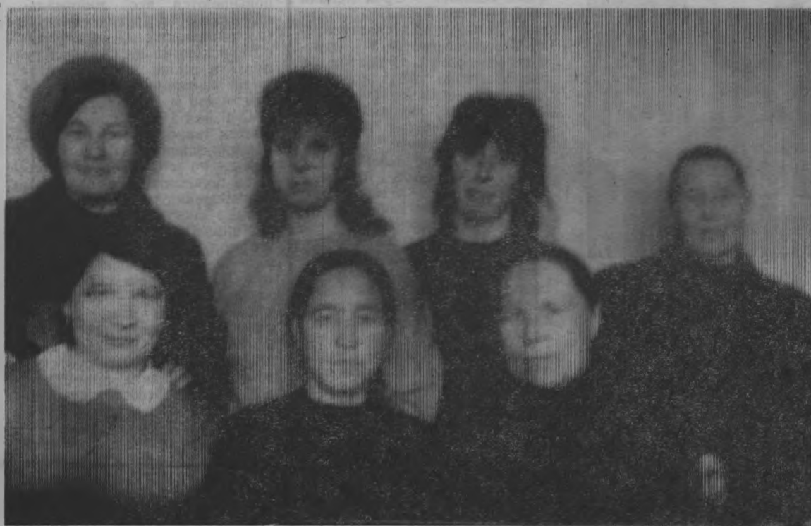
На снимке: бригада почтальонов районного узла связи.

ЗАВТРА— ДЕНЬ РАДИО, ПРАЗДНИК РАБОТНИКОВ ВСЕХ ОТРАСЛЕЙ СВЯЗИ