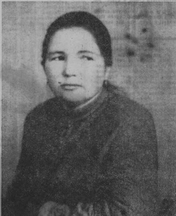
ДОЯРКА ТОО „КОММУНАР“